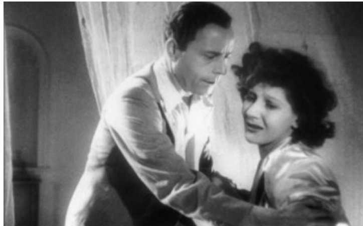
"Aventure malgache", 1944.