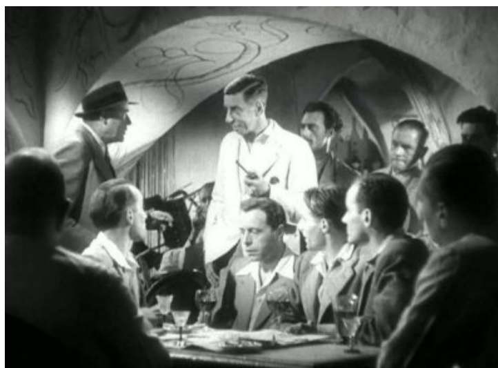
Réunion au sein de la résistance à Madagascar. "Aventure malgache", 1944.