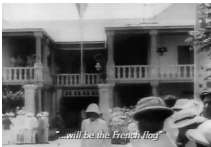
Séquence extérieure. "Aventure malgache", 1944.