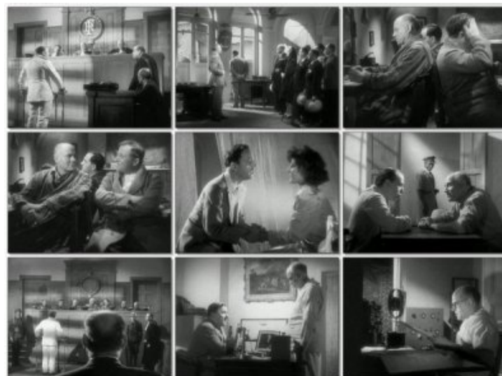
"Aventure malgache", 1944.

Le manque de moyens se ressent particulièrement à travers « Aventure malgache » : on est bien loin de la Grande Île puisque le tournage se déroule en Grande Bretagne. La plupart des scènes sont, pour cette raison, filmées en intérieur.