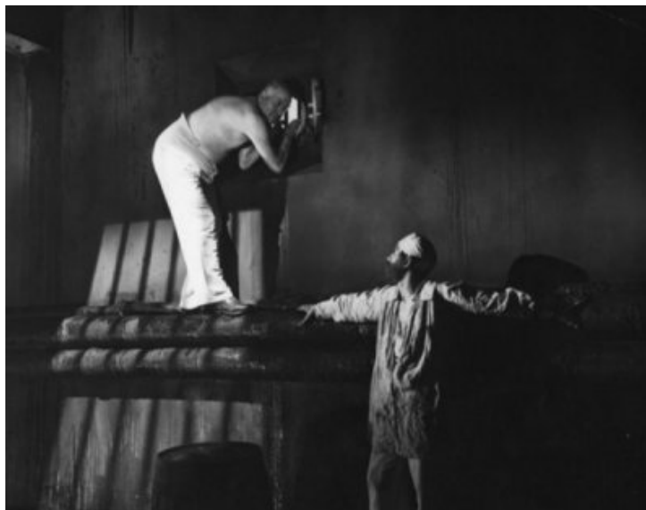
"Aventure malgache", 1944.

Le texte d'introduction qui défile sur l'écran plante le décor et l'intrigue : « Londres, 1944. Une poignée de comédiens réunis à Londres avait été chargée par les autorités militaires françaises de former une troupe, de présenter des spectacles pour les soldats, pour les civils et aussi pour ces nombreux Anglais qui aiment la France et la connaissent. L'un des acteurs de cette troupe était jusqu'à la guerre avocat à Madagascar... Mais écoutez son histoire ».