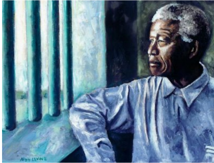
Mandela, Robben Island, by Alan Levine