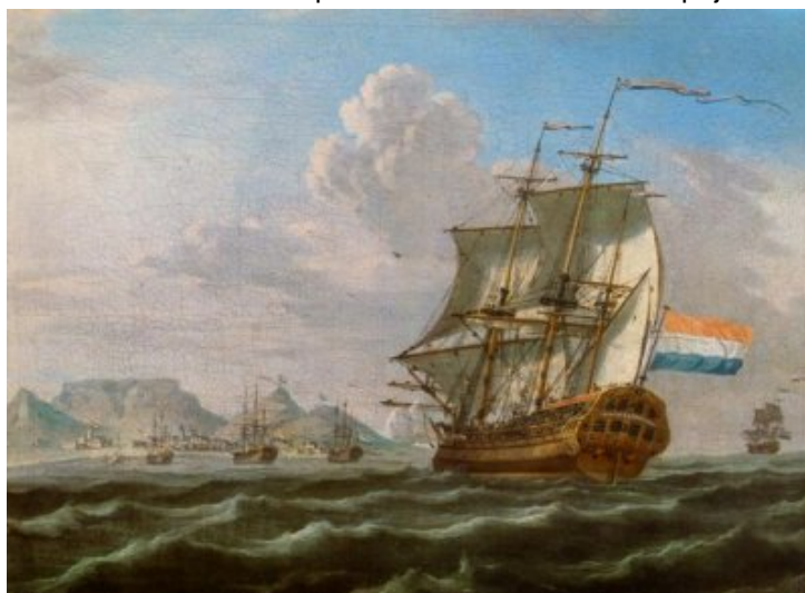
Le "Meermin".

A bord de bateau, personne lavé pas vu rien, la côte té trop loin. Té i resse environ trente matelot ec inn cinquantaine malgache. Bonna té i attann la chaloupe i revient. Zot la attann sept jour.