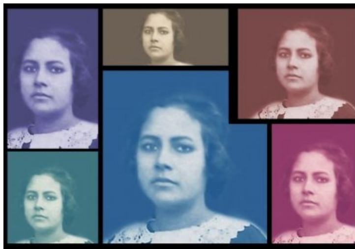
La belle Toune à 22 ans.

La belle Toune est née le 1er juin 1905 à Saint-Pierre de La Réunion. Elle fut l'une des premières femmes réunionnaises à obtenir le permis de conduire. Son destin extraordinaire la conduit jusqu'aux salons parisiens où elle sera mannequin pour le grand couturier Jean Patou. À travers un vieil album-photos retrouvé au fond d'un tiroir, voici l'histoire de celle que les intimes surnommaient Toune et qui est morte le 4 septembre 1997.