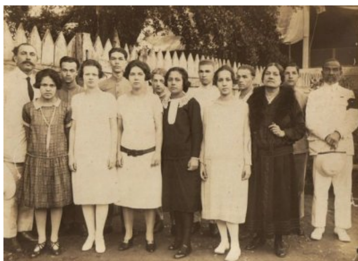
1927. Au premier rang avec les élèves de l'école normale, Toune (22 ans) porte toujours son air sombre au visage. Son père, tout en blanc, se tient sur la droite de la photo, son casque colonial dans les mains, à côté de sa nouvelle femme, à l'air sévère, vêtue de noir. Aucun sourire sur les visages.