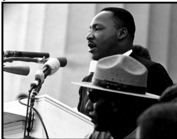
Martin Luther King, Washington, DC, 28 août 1963.

Il y a des gens qui demandent aux militants des Droits Civiques : « Quand serez-vous enfin satisfaits ? » Nous ne serons jamais satisfaits aussi longtemps que le Noir sera la victime d'indicibles horreurs de la brutalité policière. Nous ne pourrons être satisfaits aussi longtemps que nos corps, lourds de la fatigue des voyages, ne trouveront pas un abri dans les motels des grandes routes ou les hôtels des villes.