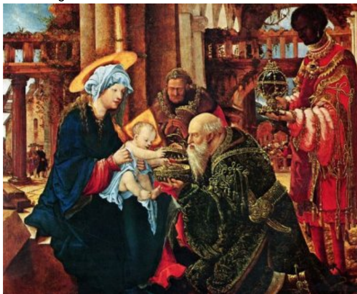
Adoration des mages, par Altdorfer, vers 1530.

Lorsque le catholicisme s'est instauré dans les pays d'Europe, les papes et les prêtres ont compris que les populations ne renonceraient pas facilement à cette tradition, d'autant qu'il s'agissait de faire la fête, de manger et de boire. Ils ont donc adopté deux stratégies.