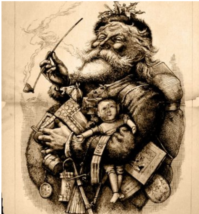
Santa Claus, par Thomas Nast. Gravure sur bois publiée le 1er janvier 1881 par le "Harper's Weekly".

Par la suite, sous l'influence des marchands de jouets et autres commerçants, le personnage de Saint-Nicolas s'est mélangé à un autre personnage de légende des pays nordiques appelé « Santa Klaus », vêtu de vert, qui venait du Pôle Nord dans un traîneau tiré par des rennes avec des cadeaux pour les enfants.