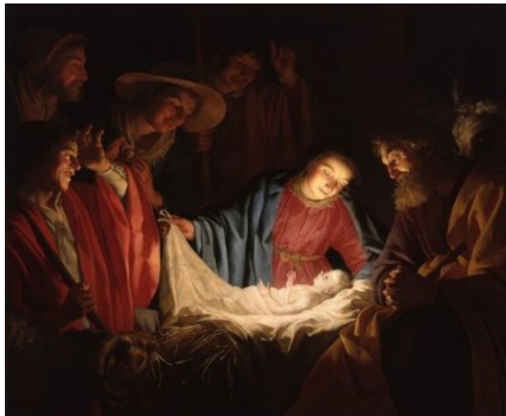
Oeuvre de Gerard van Honthorst.

D'une part, à cette époque, on ne comptait pas les mois et les années comme nous le faisons aujourd'hui. D'autre part, le prêtre appelé Denis, qui a été chargé de mener ce travail, s'est trompé dans ses calculs, en essayant de remonter à partir de la date approximative de la fondation de la ville de Rome.