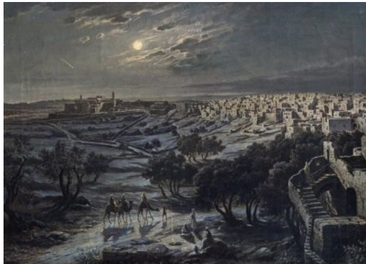
Bethlehem, la nuit. Josef Langl.

Il y a d'autres événements historiques connus qui démontrent que Jésus n'est pas né cette année-là, mais vraisemblablement avant.