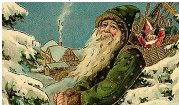
L'ancêtre du Père Noël, vêtu de vert.

Ensuite, un pape appelé Grégoire XIII a décidé en 1582 de changer le calendrier et a fixé le début de l'année au mois de janvier. On a donc commencé à donner les étrennes au 1er janvier et on a pris l'habitude de donner des faux cadeaux et de faire des farces le 1er avril [le calendrier actuel s'appelle le calendrier grégorien]. Voilà donc comment a été instaurée la coutume des cadeaux pendant les fêtes.