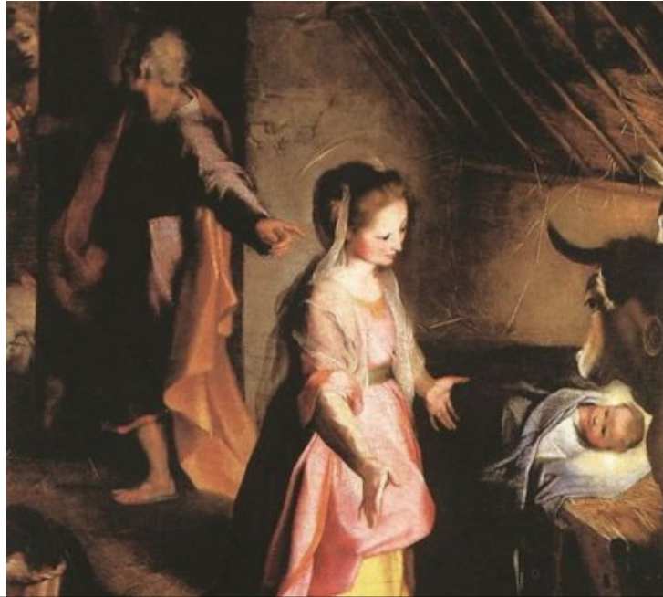
"Nativité", par Frederico Barocci (1528-1612).