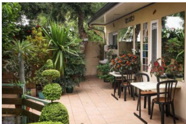
"L'ambéric", au Tampon. 3ème restaurant réunionnais dans "La Liste" des 1000 meilleurs restaurants au monde.

" Au rang des découvertes, on relève l'entrée dans le top 1 000 de restaurants situés aux Emirats Arabes Unis, en Angola et au Vietnam ».