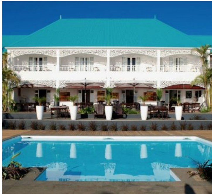
"Le Blue Margouillat", à Saint-Leu. 2ème restaurant réunionnais dans "La Liste" des 1000 meilleurs restaurants au monde.