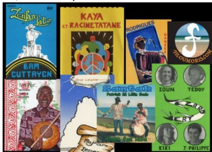
Sur filoumoris.com .

Soucieux du patrimoine musical et artistique , il a minutieusement organisé la sauvegarde et la transmission de cet héritage. Des trésors pour l'océan Indien à€” et pour le monde à€” amassés au fil du temps. Son site filoumoris , mis en ligne en décembre 2017, est d'ores et déjà devenu une référence.