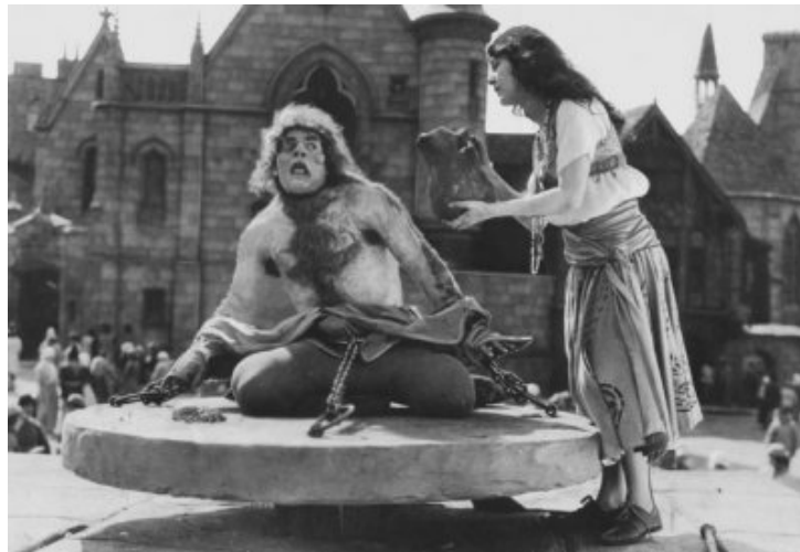
Quasimodo [Lon Chaney] et Esmeralda [Patsy Ruth Miller]. Image extraite du film "Le bossu de Notre Dame", 1923.

« Si je ne mets pas mon doigt à l'endroit des clous... »