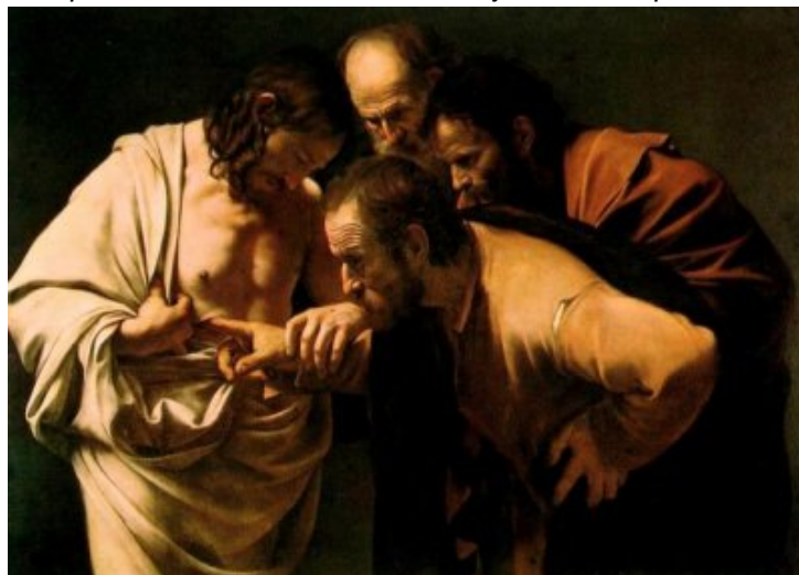
"L'incrédulité de Saint Thomas".

Le « Dimanche de Quasimodo » est aussi le jour où l'on lit le récit de l'apôtre Thomas à€" l'incrédule à€" refusant de croire à la Résurrection. « Si je ne vois pas dans ses mains la marque des clous, si je ne mets pas mon doigt à l'endroit des clous, si je ne mets pas la main dans son côté, non, je ne croirai pas ! »