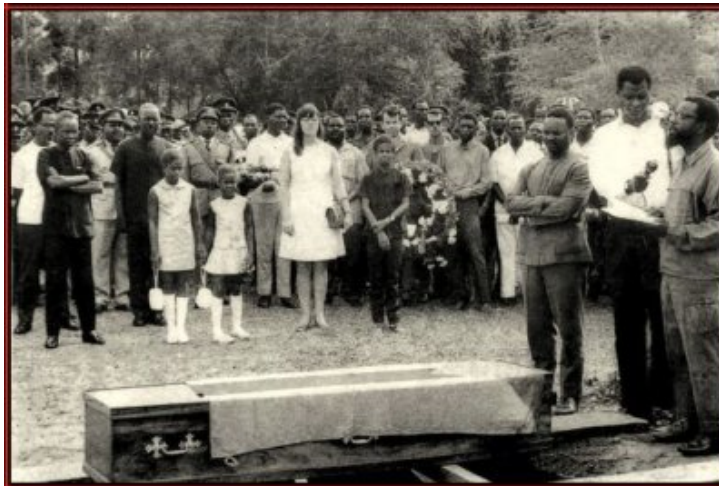
Funérailles d'Eduardo Mondlane. Au milieu, sa femme, Janet, entourée de leurs enfants.

Accordant ses actes à ses paroles , il avait démissionné de son poste d'enseignant à l'Université de Syracuse, dans l'Etat de New York.