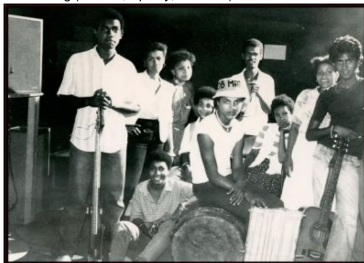
Le groupe "Zordi".

« Ce site est "non commercial" , précise Philippe de Magnée. Pas un centime, un sou ou une roupie n'est perçu. Il sert de plateforme pour ces mêmes artistes qui ont aussi des albums distribués sur internet. Il comprend des liens vers les sites de vente physique (site de l'artiste, Amazon, Discogs, etc...) vers les plateformes de téléchargement légal en ligne (I Tunes) et de streaming (Deezer, Spotify, Youtube) ».