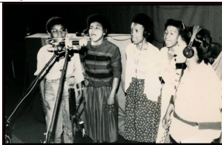
Les chanteuses du groupe Zordi.

Cliquer/écouter Mangaza Vanily , Paolo & Co, 1983