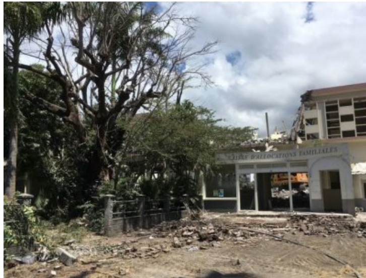
Façade sur rue du bâtiment donnant sur la rue Général de Gaulle.

80% des édifices construits à La Réunion datent de la seconde moitié du XXe siècle. Il y a urgence à réfléchir à la sauvegarde des plus remarquables d'entre eux pour que, dans les prochaines décennies, nous ne soyons pas accusés d'avoir été des vandales.