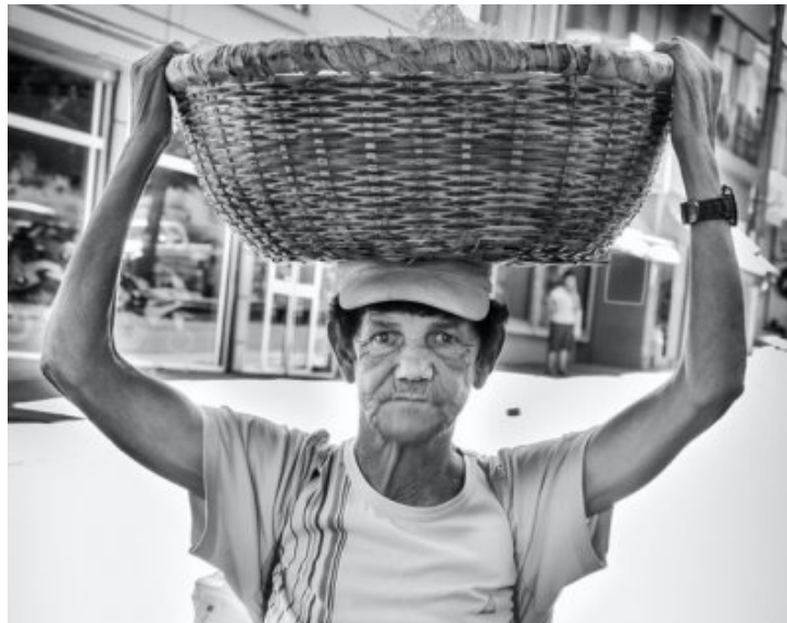
M. Pistache, 29 octobre 2014.

« La Légende Pistache... » Une statue pour ce Monsieur !