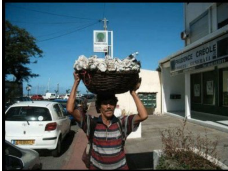
M. Pistache posant pour Yves Velou.

« Toute l'âme de La Réunion était dans sa voix qui résonne encore : "ala pistache bien grillé" ».