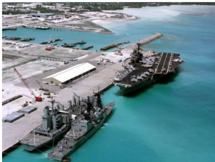
L'île de Diego Garcia et la base militaire des USA.

La solidarité indianocéanique reste à construire autour des Chagossiens. Notre comité est indigné de la non inscription de la question des Chagos à l'ordre du jour du colloque sur la paix.