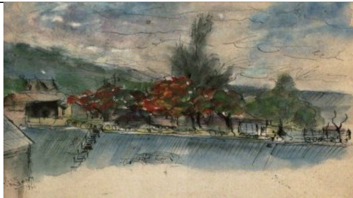
Oeuvre de Jean Albany.