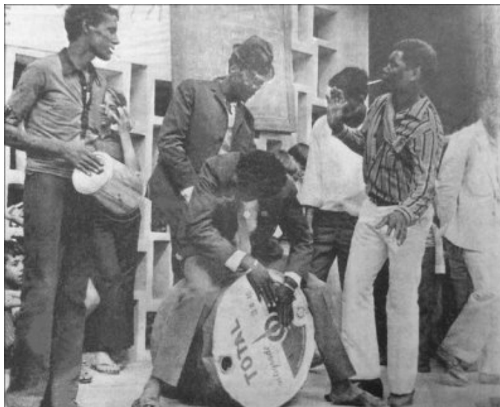
Scène de maloya au Port, années 1970, fête de Témoignages.