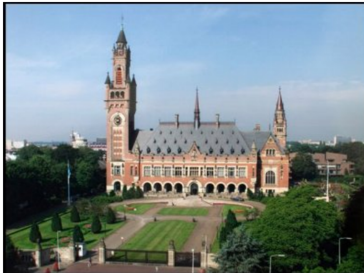
Le Palais de la Paix, siège de la Cour internationale de Justice à La Haye (Pays-Bas).