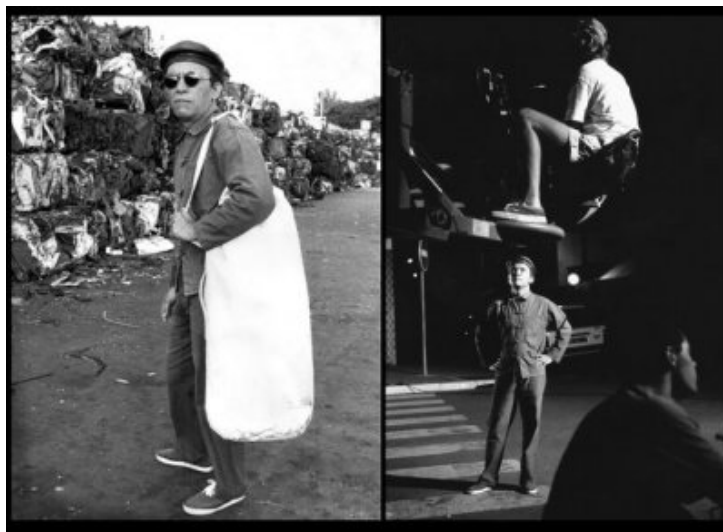
1) Ti Fock sur les docks. 2) Tournage angle des rues de Saint-Paul et François de Mahy.

Pour réaliser ces trois séquences représentant dans le clip 1 minute et 7 secondes l'équipe menée par Sandro Agénor a travaillé cette nuit-là pendant près de 4 heures d'affilée ; juste quelques pauses bouchons/Dodos/fous rires pendant lesquelles on ne relâche pas l'attention pour autant et l'on discute technique pour préparer la séquence suivante.