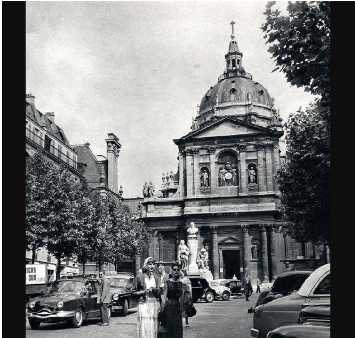
Paris, "La Sorbonne", Janine Niepce, 1950.

" « La vie caméléon », confessions d'une ex-Allemande, Éditions La Bruyère, 1994.