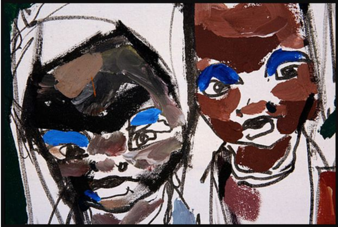
Par Aleom Teklu.

Le 23 juin 1937, une rumeur parcourt la ville de Tananarive : Jean-Joseph Rabearivelo s'est donné la mort la veille. Le grand poète malgache avait consigné ses derniers instants, décrivant la préparation du breuvage fatal et ses dernières pensées jusqu'à ce qu'il sombre dans l'au-delà. Hommage.