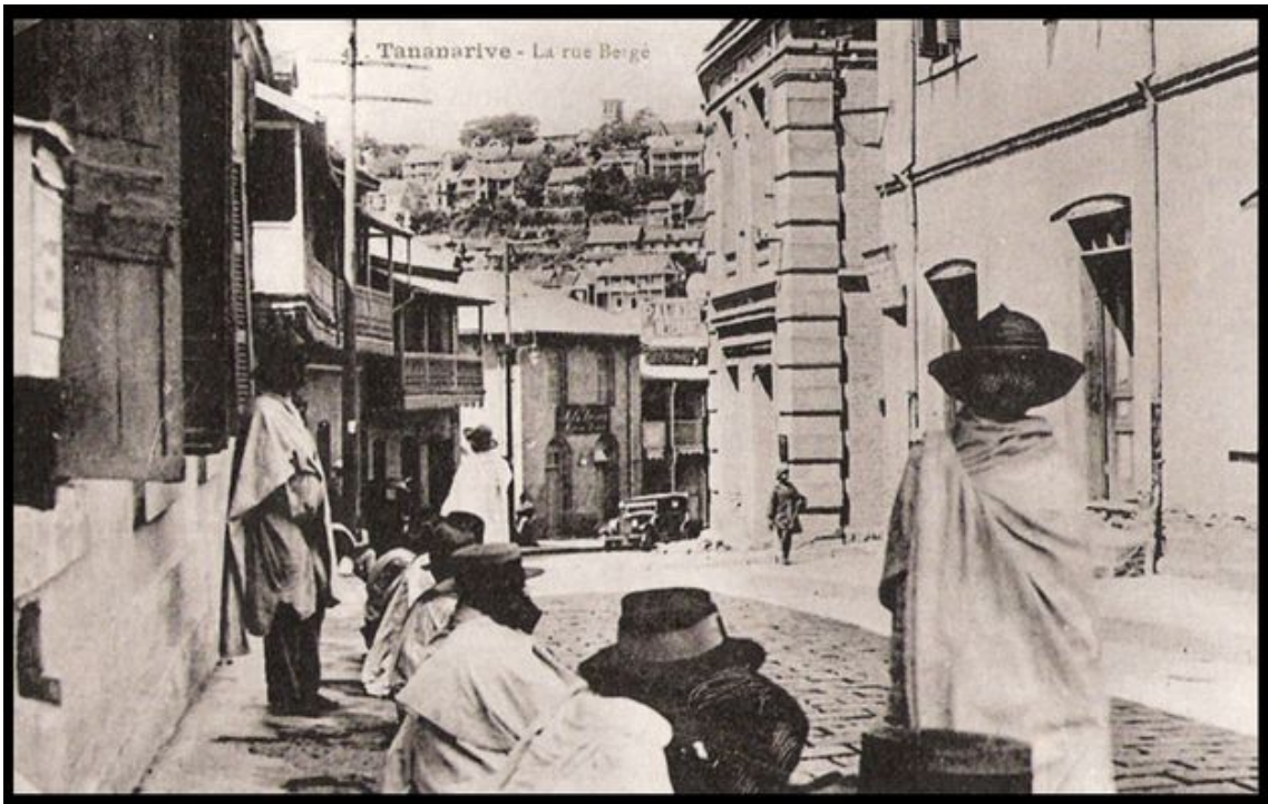
Tananarive dans les années 1930.