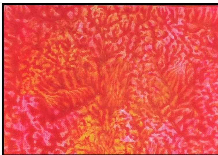
Extrait d'une oeuvre de Buffy Heslin.

â€” Sahondra je suis, donc une fleur, une fleur qui dépasse l'herbe : je désire des fleurs en grappe que je mettrai dans mes cheveux.