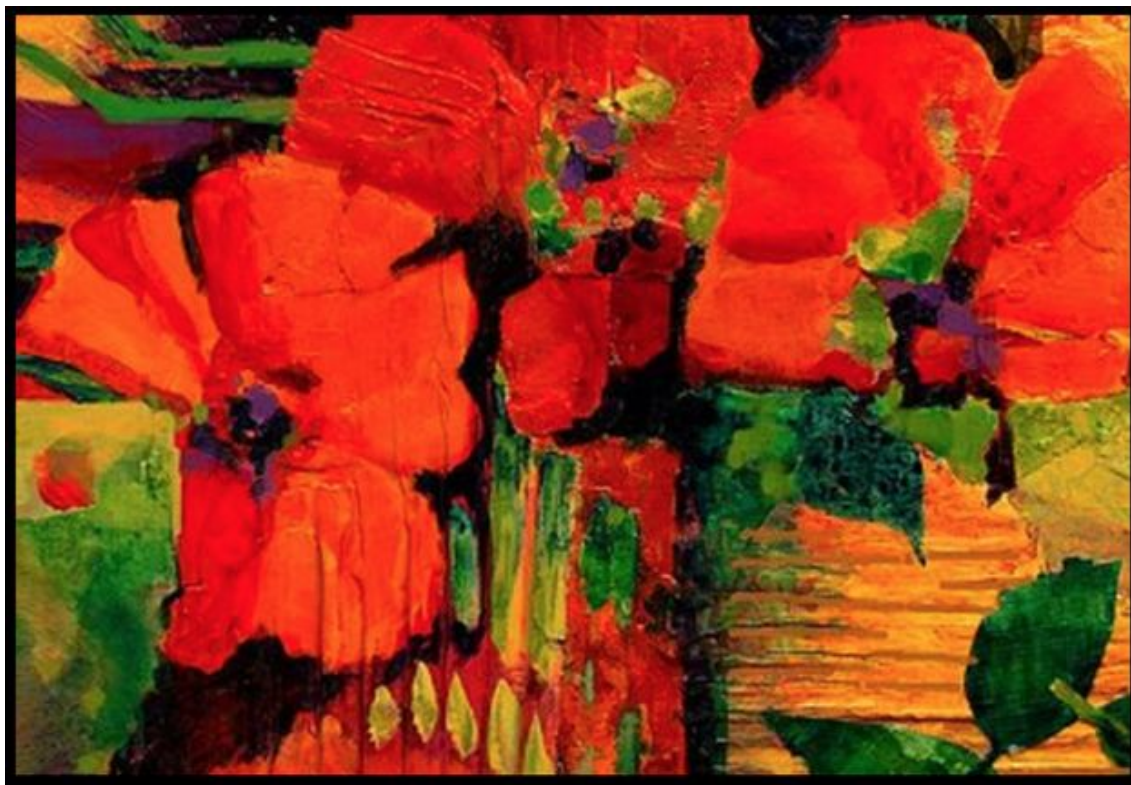
Extrait d'une oeuvre de Carol Nelson.

â€” Sahondra je suis, donc une fleur, une fleur qui dépasse l'herbe : je désire des fleurs en grappe que je mettrai dans mes cheveux.