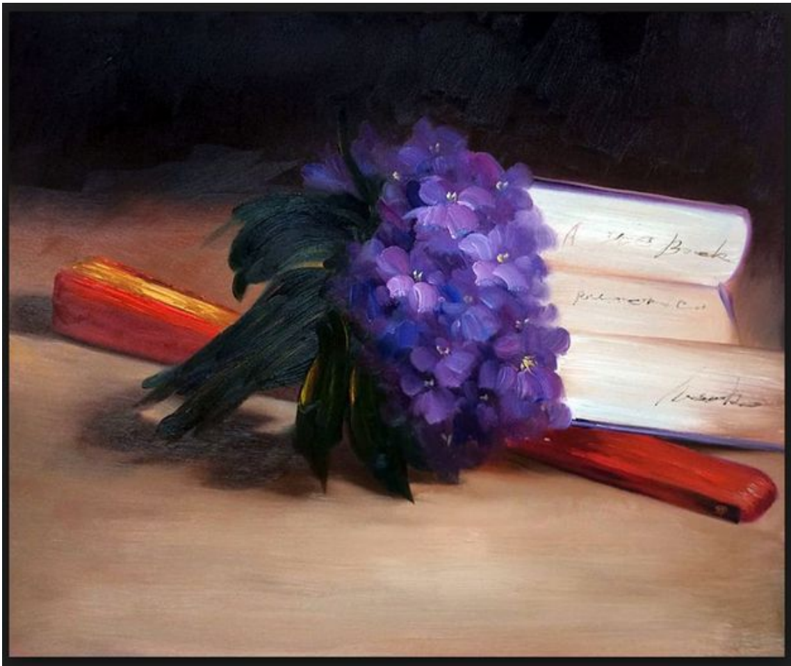
"Bouquet de violettes", Edouard Manet.