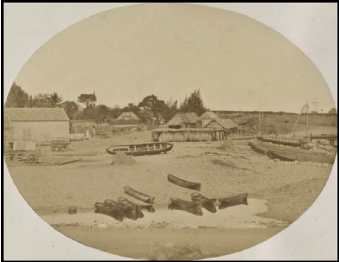
Le bord de mer de La Possession, 1861.

[Extrait d'un récit édité en 1868, intitulé « Recherches sur la faune de Madagascar et de ses dépendances », d'après les découvertes de François P. L. Pollen et de D. C. Van Dam.]