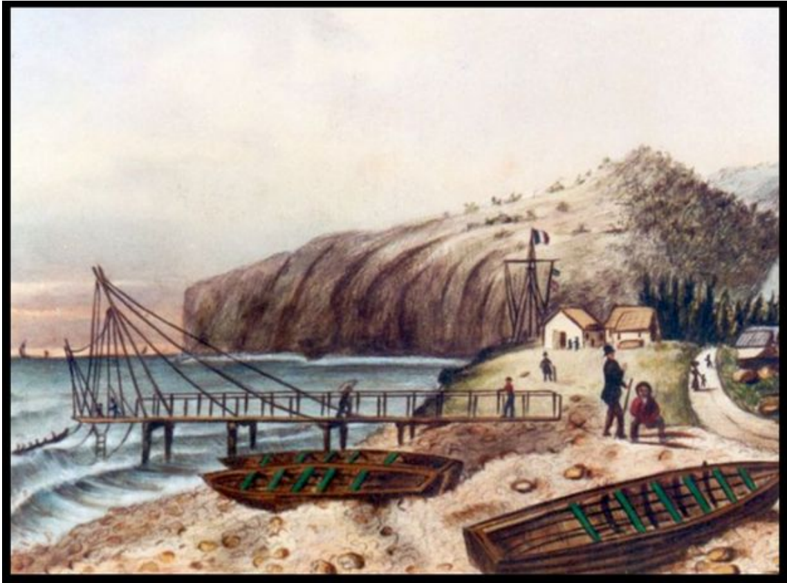
Le bord de mer de La Possession avec le service de batelage, par Antoine Roussin, 1847.