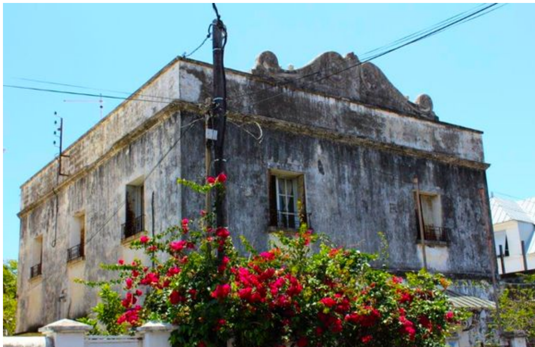
Rue La Bourdonnais.