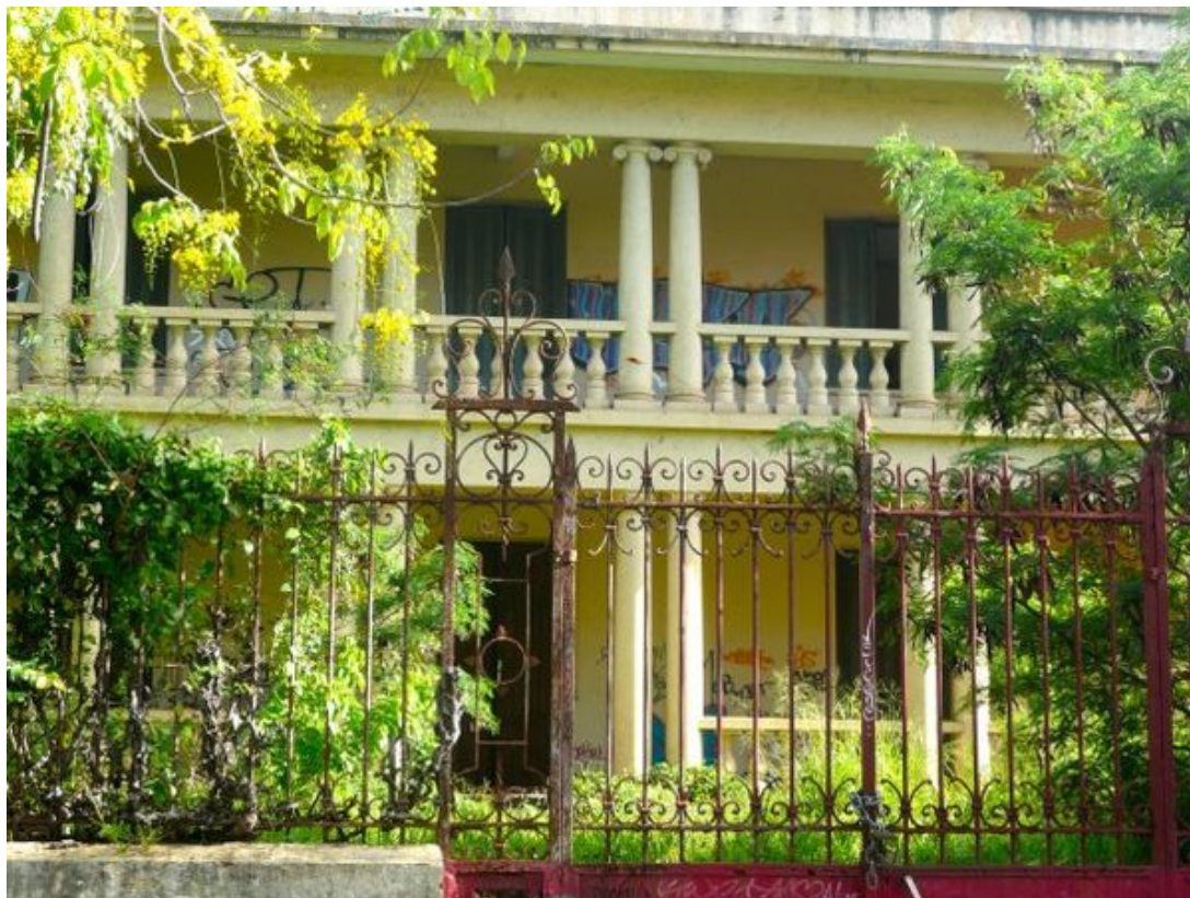
La maison Hugot, rue Sainte-Anne.

« Albasama », entre nostalgie et mystère