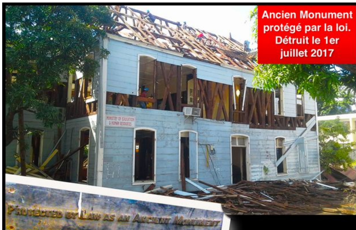
La fin de "La School"...

Vendredi soir, les destructeurs sont entrés en action : la plus vieille bâtisse en bois de Port Louis (1780) qui avait abrité le collège Royal, communément appelée « La School », a été effacée du paysage. Cet édifice était considéré comme l'un des dix plus anciens bâtiments en bois de l'hémisphère Sud. « Désastre, crime, tristesse, consternation... » sont les mots employés par les Mauriciens qui militaient pour la sauvegarde de cette construction classée au patrimoine national depuis 1985. D'une île à l'autre, de Maurice à La Réunion, le même mal ronge l'histoire.