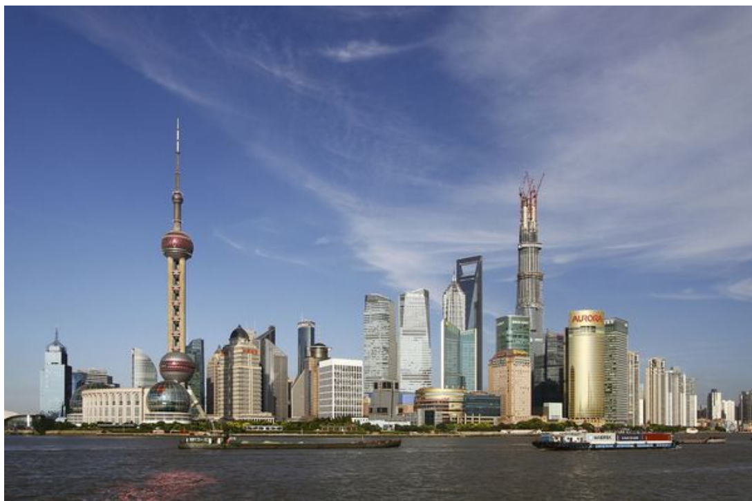
Shanghai