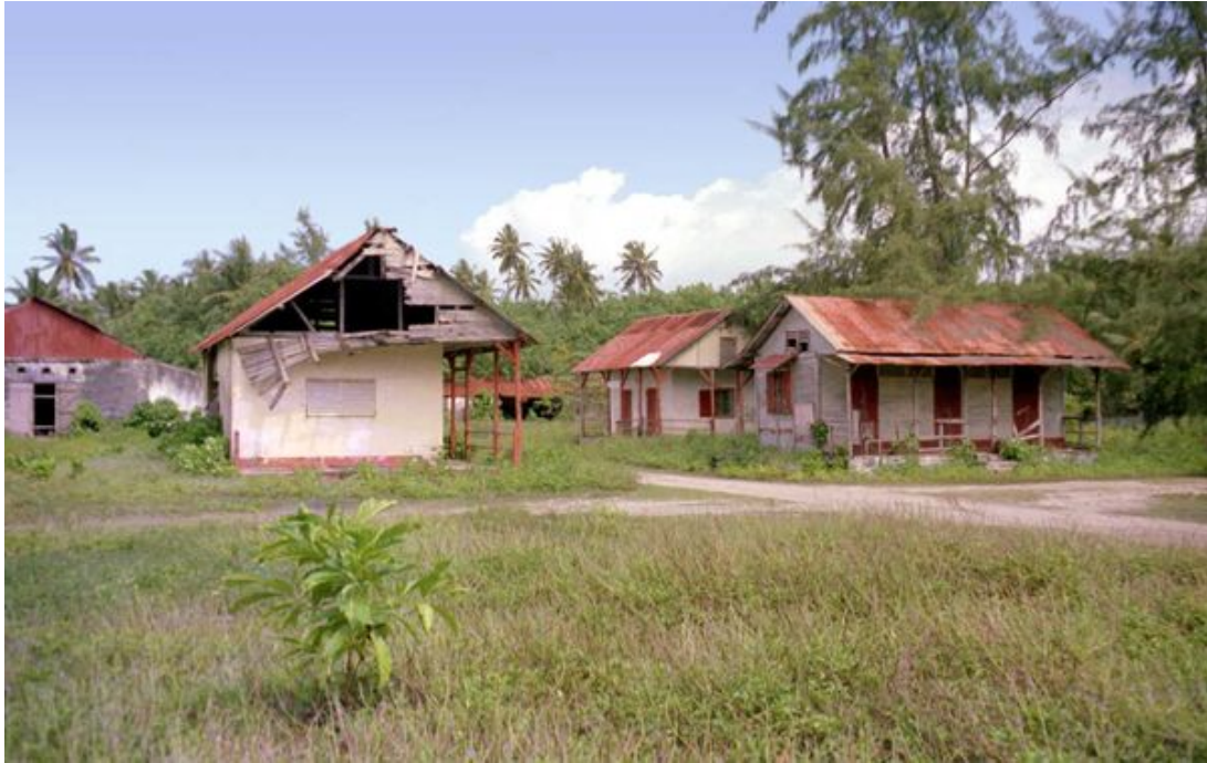
1970 : constructions abandonnées sur l'île de Diego Garcia.