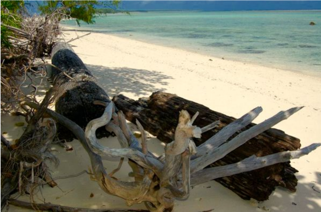
Chagos : le paradis volé...