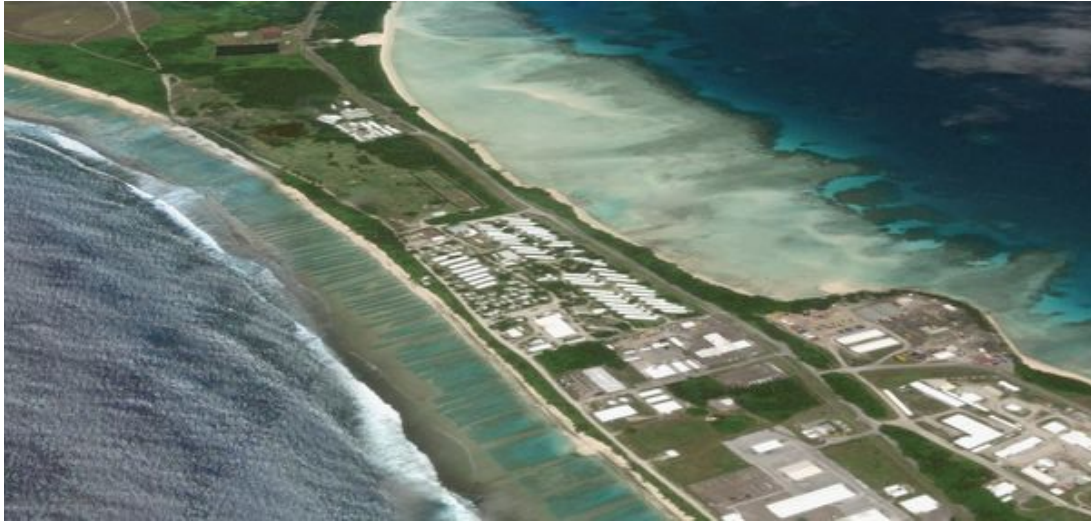
Vue partielle des installations militaires de l'US Army sur l'île de Diego Garcia.