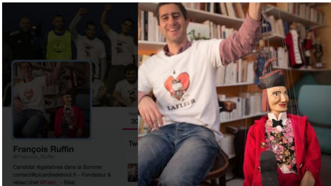
François Ruffin, compte Twitter.

... qui se fait piéger comme un enfant dans « Merci Patron ! »