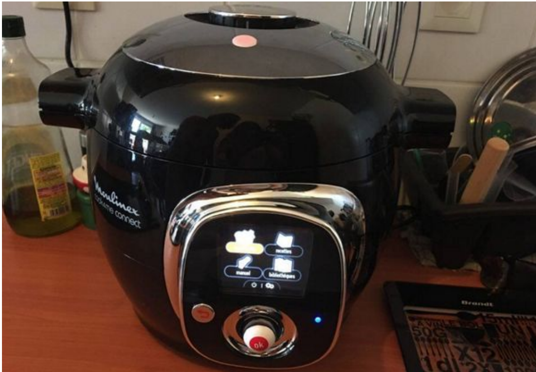
Le multicuiseur intelligent

Si nous ramenons notre fraise aujourd'hui, ce n'est pas pour casser du sucre sur le dos de Moulinex, mais c'est parce que le « premier multicuiseur intelligent connecté » conçu « pour me simplifier la vie », ne doit pas m'induire en erreur.