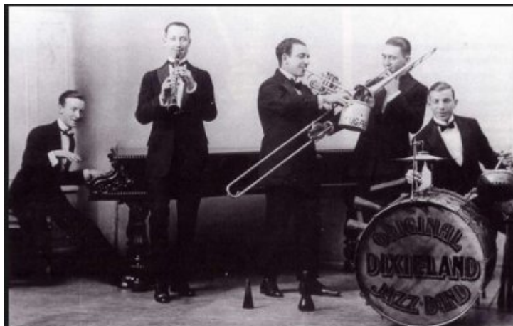
« Original Dixieland Jazz Band »

Le durcissement des lois « Jim Crow » sur la ségrégation raciale en Louisiane, dans les années 1890, agira comme un frein sur le développement du jazz : « Les musiciens professionnels de couleur ne furent plus autorisés à se produire en compagnie de musiciens blancs ».