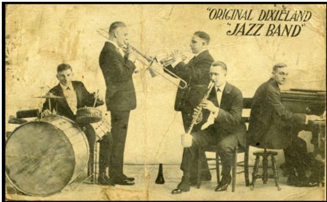
« Original Dixieland Jazz Band ». Carte postale de 1918.