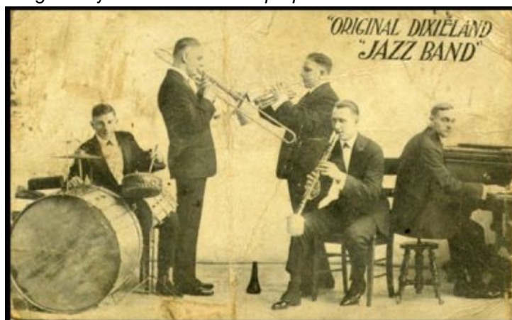
« Original Dixieland Jazz Band ». Carte postale de 1918.

Le 7 mars 1917, il y a 101 ans, ce premier disque de jazz est mis sur le marché et remporte un certain succès à€” un million et demi d'exemplaires vendus à€” même si les puristes jugent ce « jazz plutôt ordinaire, pour ne pas dire médiocre, comparé à celui des grands jazzmen noirs de l'époque ».