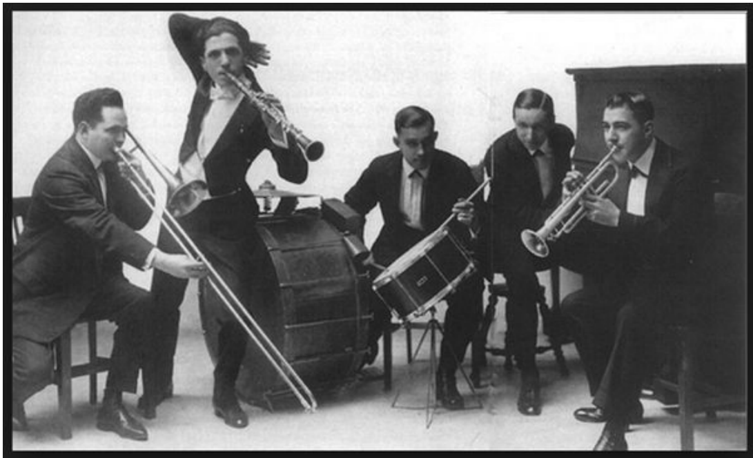
« Original Dixieland Jazz Band »

Il y a 100 ans, le 7 mars 1917, un disque 78 tours du groupe « Original Dixieland Jazz Band » est mis sur le marché par la « Victor Talking Machine Company ». Ce 78 tours sera considéré comme le premier disque de jazz. Dans ce début de 20ème siècle, la société américaine est dominée par une ségrégation raciale dont les répercussions n'épargnent pas la musique : parmi les cinq musiciens qui enregistrent ce premier disque de jazz, on ne trouve aucun Noir.