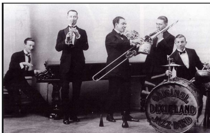
« Original Dixieland Jazz Band »

Le durcissement des lois « Jim Crow » sur la ségrégation raciale en Louisiane, dans les années 1890, agira comme un frein sur le développement du jazz : « Les musiciens professionnels de couleur ne furent plus autorisés à se produire en compagnie de musiciens blancs ».