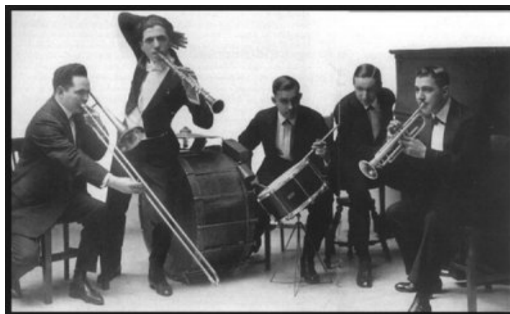
« Original Dixieland Jazz Band »

Il y a 101 ans, le 7 mars 1917, un disque 78 tours du groupe « Original Dixieland Jazz Band » est mis sur le marché par la « Victor Talking Machine Company ». Ce 78 tours sera considéré comme le premier disque de jazz. Dans ce début de 20 ème siècle, la société américaine est dominée par une ségrégation raciale dont les répercussions n'épargnent pas la musique : parmi les cinq musiciens qui enregistrent ce premier disque de jazz, on ne trouve aucun Noir.