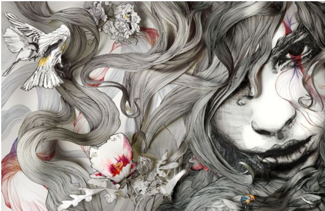
En 1795, Fanny porte plainte pour avoir été contrainte de se livrer à la prostitution. Oeuvre de Gabriel Moreno.