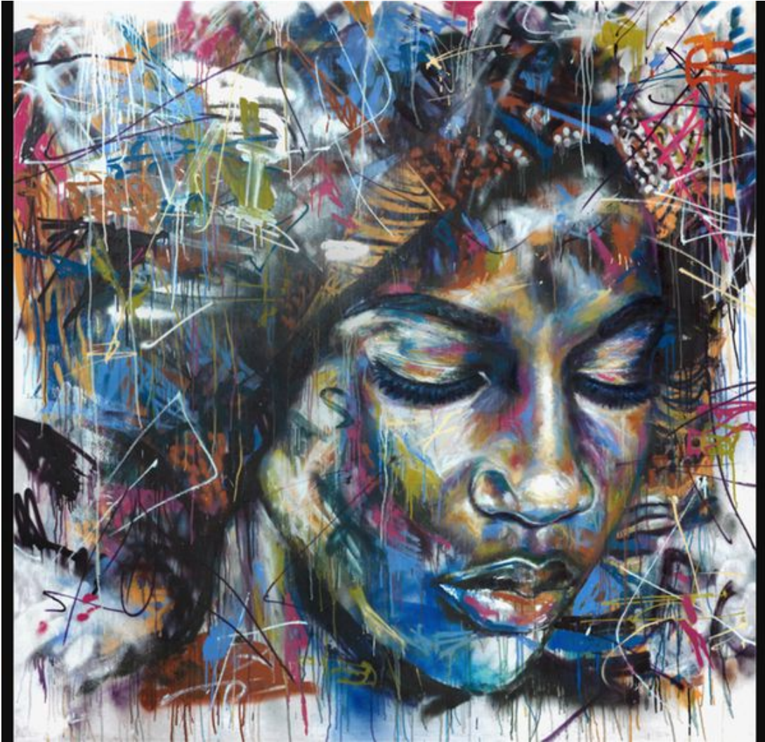
Fanny sait que quoi qu'elle fasse, elle restera pour les Blancs, Fanny « la noire ». Oeuvre de David Walker.