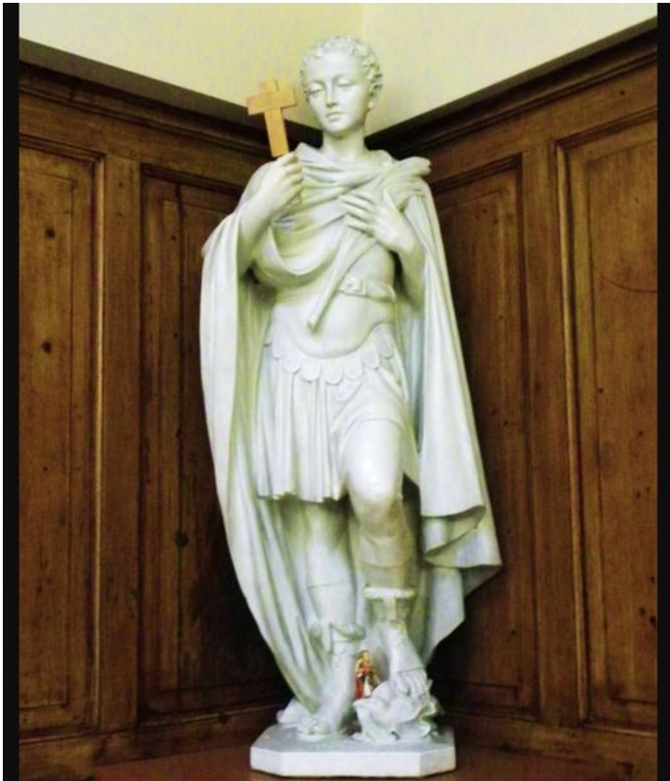
Saint-Expédit, dans l'église de la Madeleine.