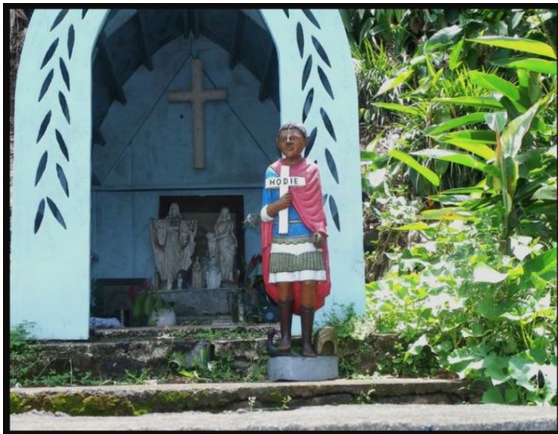
Saint-Expédit malgache sur la route de la Ravine à Malheur.

Le culte de Saint-Expédit se porte bien ! Plus de 400 autels lui sont dédiés et jalonnent les paysages réunionnais. Mais on trouve aussi la statue du légionnaire romain décapité en l'an 303 dans la plupart des églises de France et dans de nombreux pays : Maurice, Italie, Portugal, Belgique, Canada, Amérique du Sud, etc.