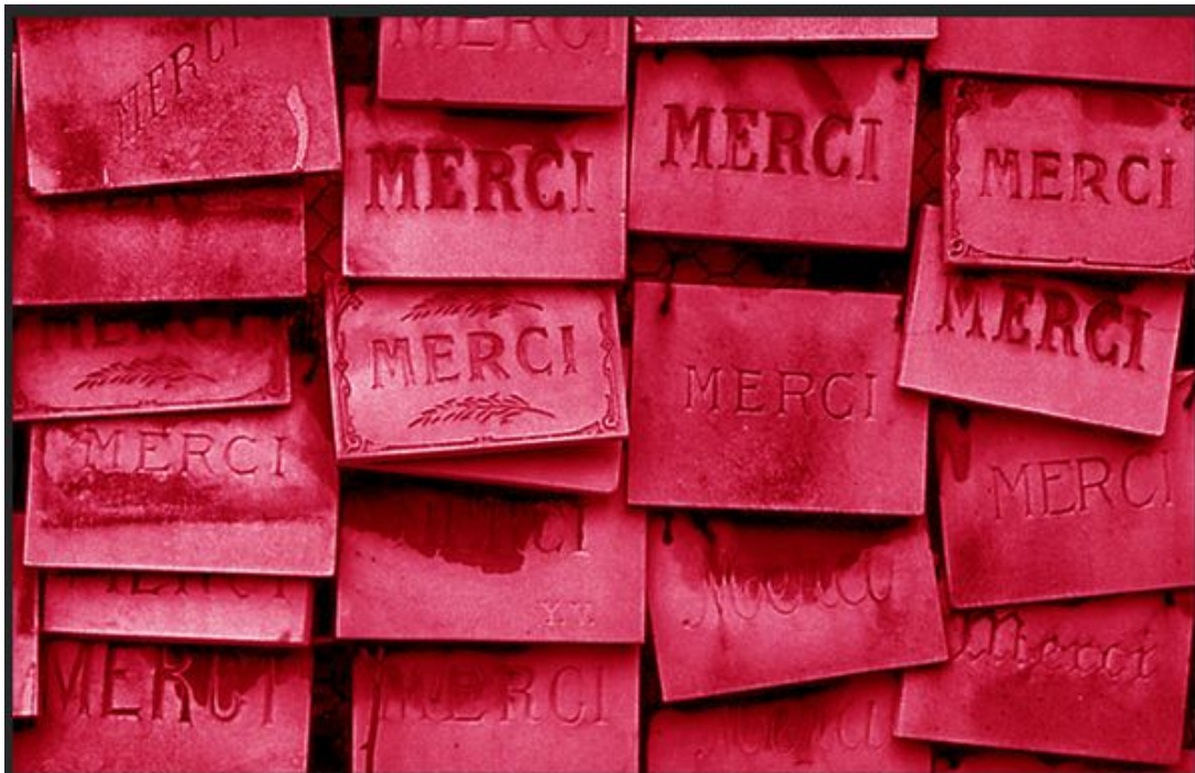
Ex voto by SUDOR (extrait).