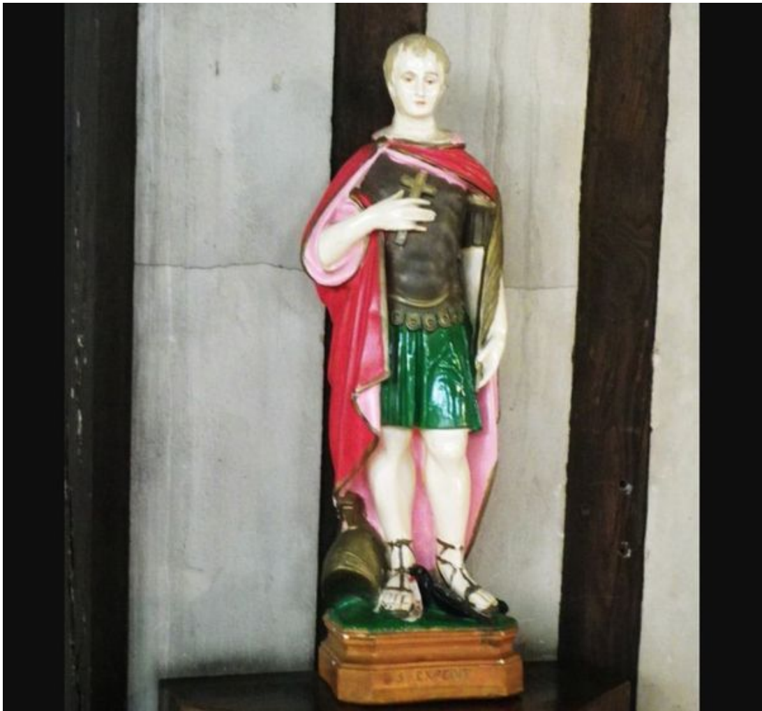
Saint-Expédit dans l'église de Honfleur.