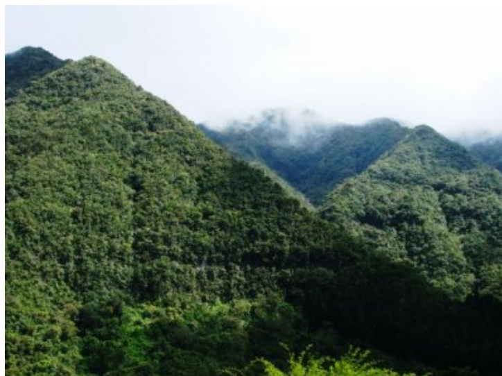
Les pyramides naturelles des Makes.