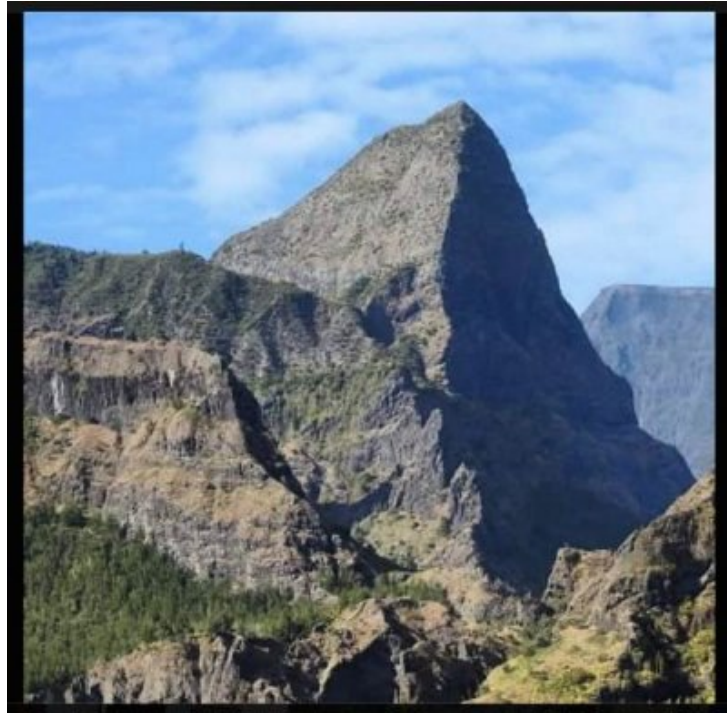
Mafate. Le piton Cabri et sa "silhouette sculptée" de pyramide.