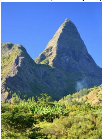
Piton des Calumets à Mafate.