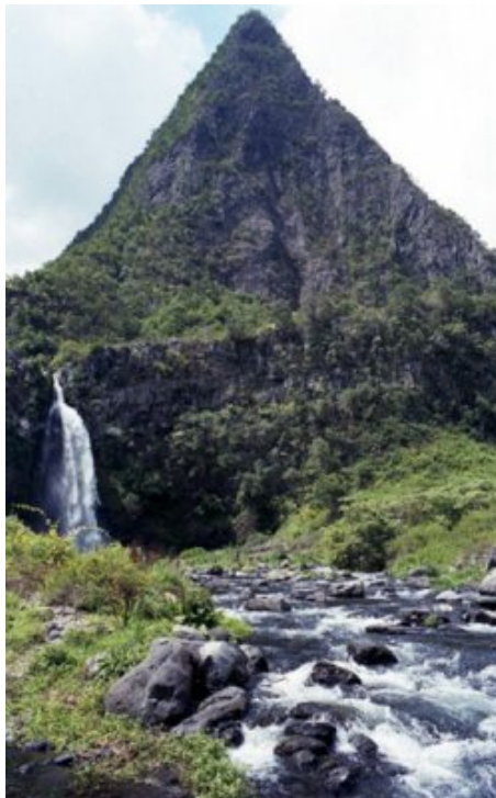
La pyramide égarée... et retrouvée par loucamino.