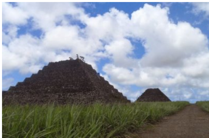
Ile Maurice : pyramides issues de l'épierrage des champs... ou d'une "ancienne civilisation" selon quelques adeptes d'histoires mystérieuses...