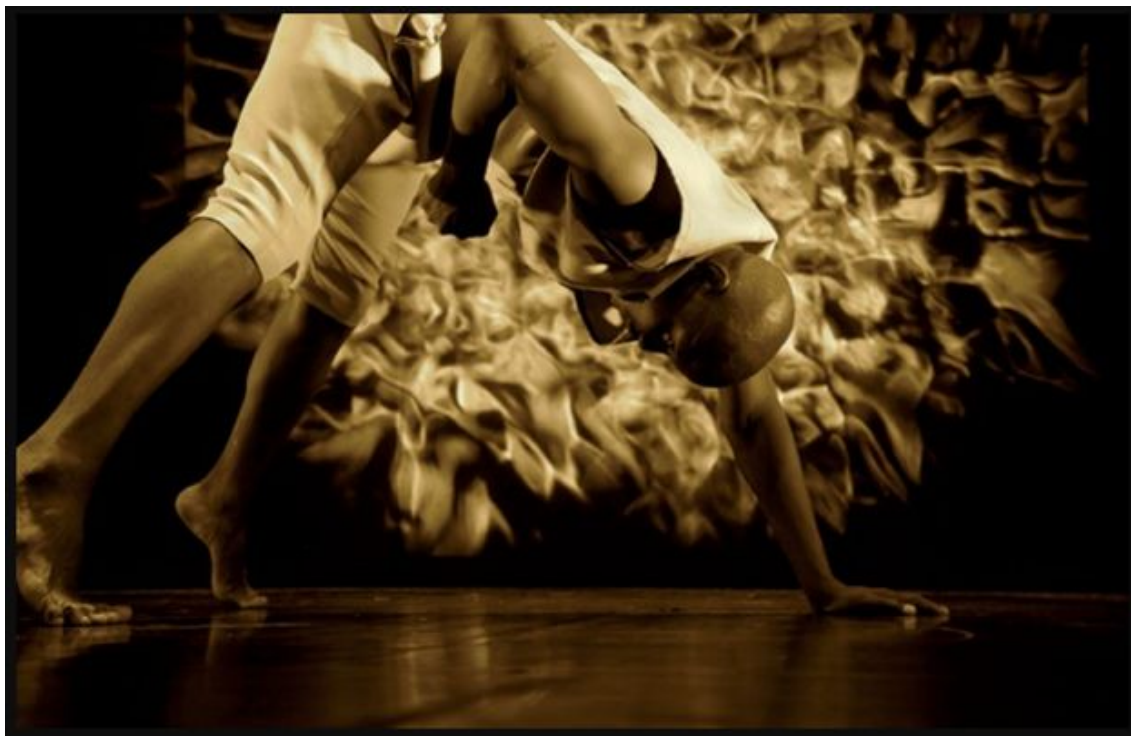
"Body Of Knowledge".

« Soul City » ne défend pas une danse mais des valeurs