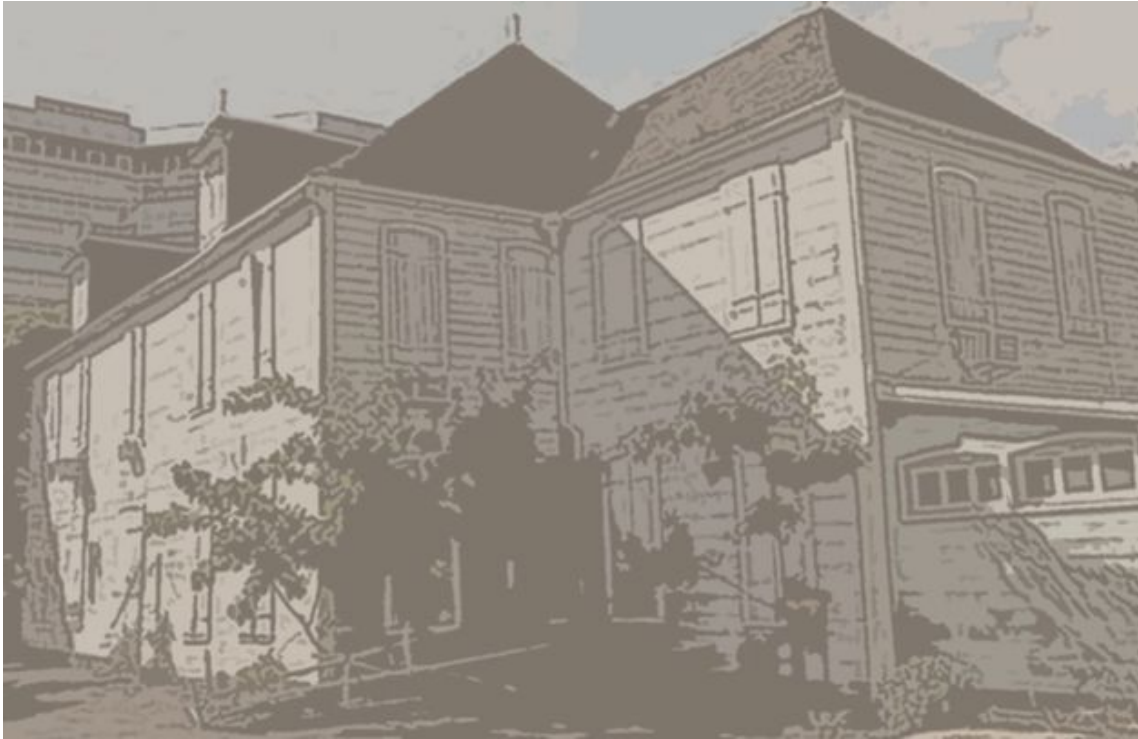
"La School" à Port Louis. Détruite le 30 juin et le 1er juillet 2017.