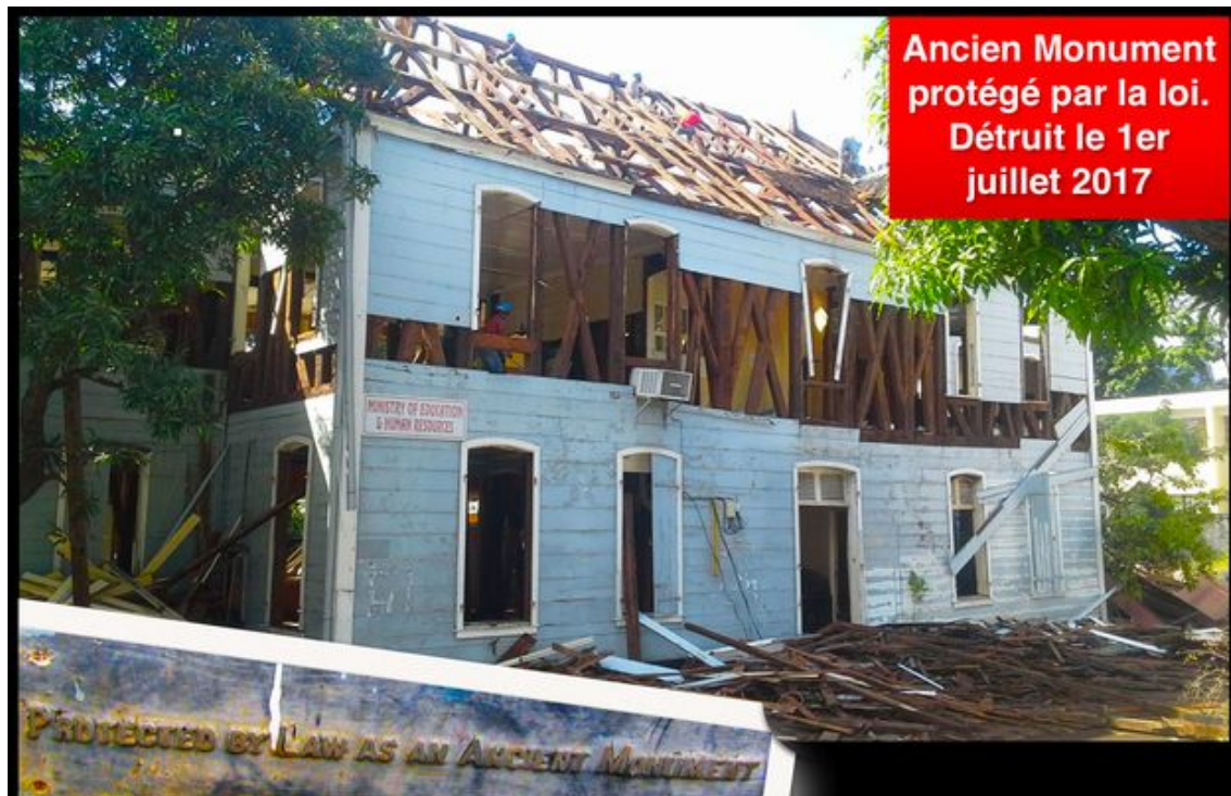
La fin de "La School"...

Vendredi soir, les destructeurs sont entrés en action : la plus vieille bâtisse en bois de Port Louis (1780) qui avait abrité le collège Royal, communément appelée « La School », a été effacée du paysage. Cet édifice était considéré comme l'un des dix plus anciens bâtiments en bois de l'hémisphère Sud. « Désastre, crime, tristesse, consternation... » sont les mots employés par les Mauriciens qui militaient pour la sauvegarde de cette construction classée au patrimoine national depuis 1985. D'une île à l'autre, de Maurice à La Réunion, le même mal ronge l'histoire.