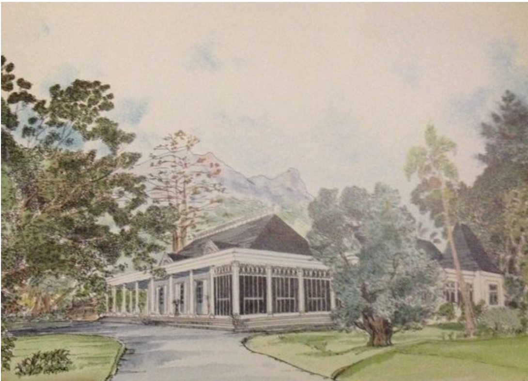
Le Clos Joli, à Moka. Maison démolie en 1986. Oeuvre de Monique de La Vallée Poussin, extraite de "La vie en varangue", architecture traditionnelle de l'île Maurice, 1989, Editions du Pacifique.