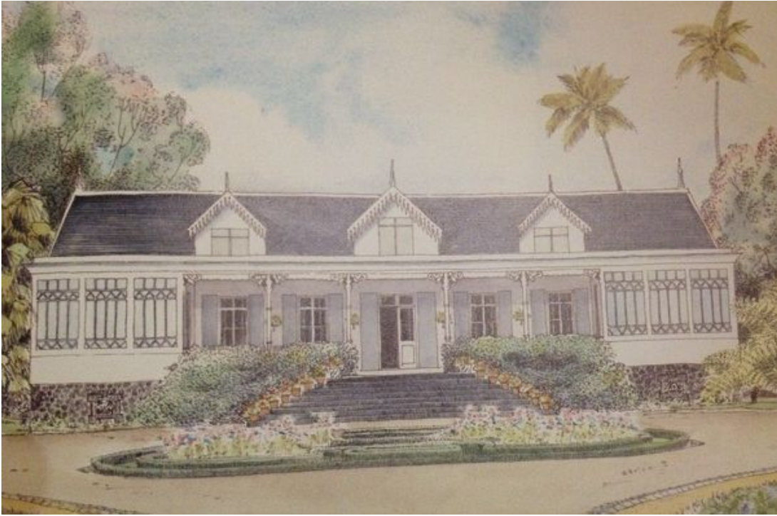
Villa Surprise à Curepipe. Démantelée après le cyclone Carol en 1960. Oeuvre de Monique de La Vallée Poussin, extraite de "La vie en varangue", architecture traditionnelle de l'île Maurice, 1989, Editions du Pacifique.