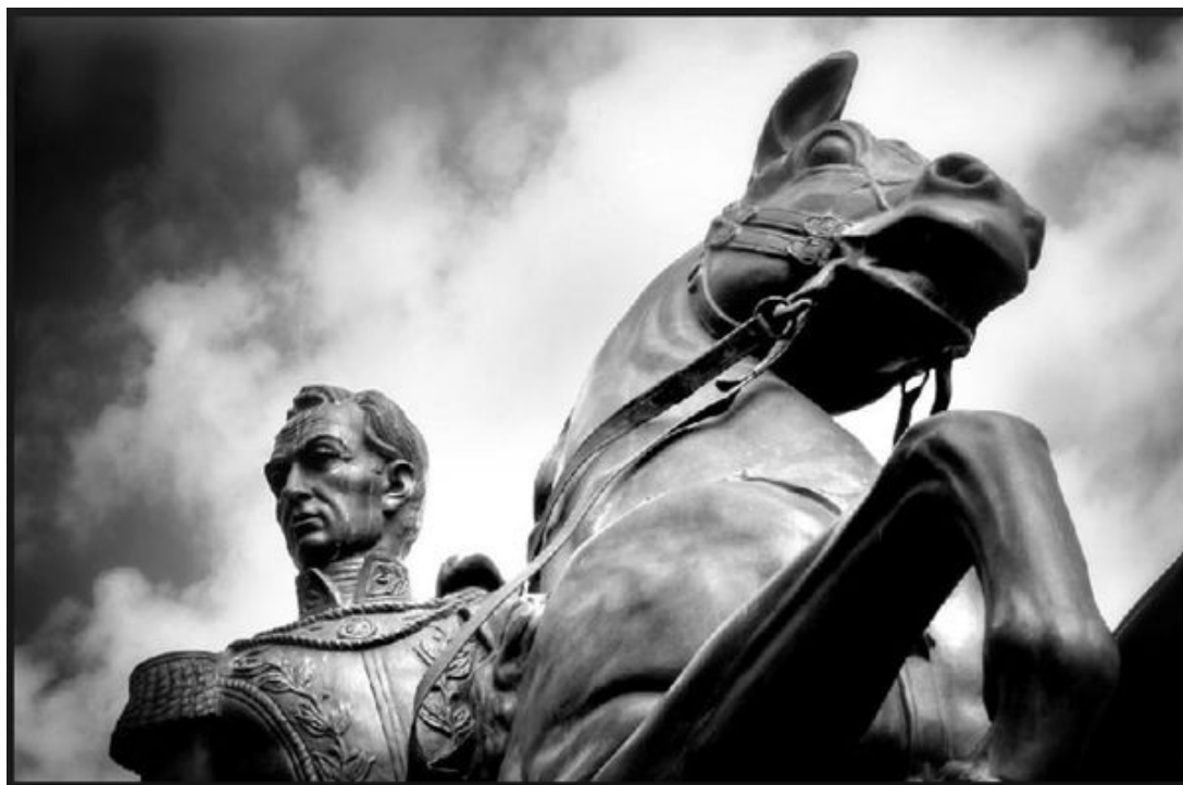
Statue équestre de Simon Bolivar.

Suite à la polémique autour du point 62 de « L'Avenir en Commun », programme de La France Insoumise porté par Jean-Luc Mélenchon, il est temps de rétablir quelques vérités.