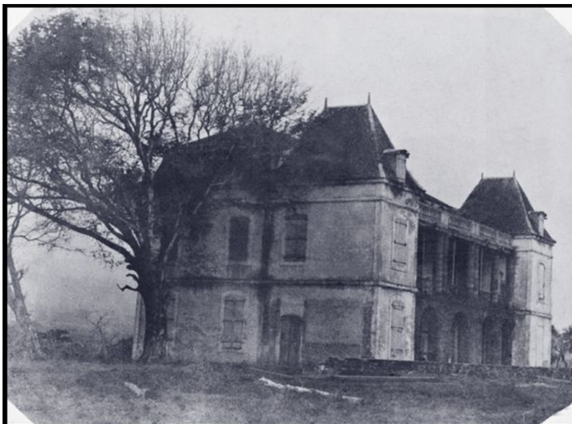
Le château du Gol, à Saint-Louis.

Portes et fenêtres closes. Terrain en friche. Murs décrépis. Cette rare photo du château du Gol (Saint-Louis) inspire un sentiment de désolation et d'abandon. Les hommes ont déserté les lieux et la nature a repris ses droits. Un arbre pousse collé contre la façade, obstruant une fenêtre, comme un défi à celui qui, à l'image d'un château de cartes, va bientôt s'écrouler... et dont il ne reste aujourd'hui plus aucune trace.