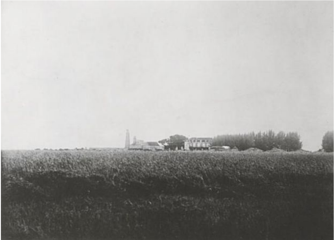
La sucrerie et le château du Gol. Fin du 19ème siècle.