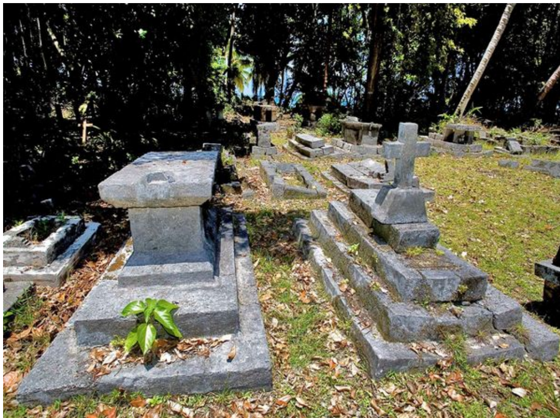
Le petit cimetière abandonné à Diego Garcia.

7 Lames la Mer : Quelle serait la première chose que vous feriez si vous pouviez retourner à Diego Garcia ?