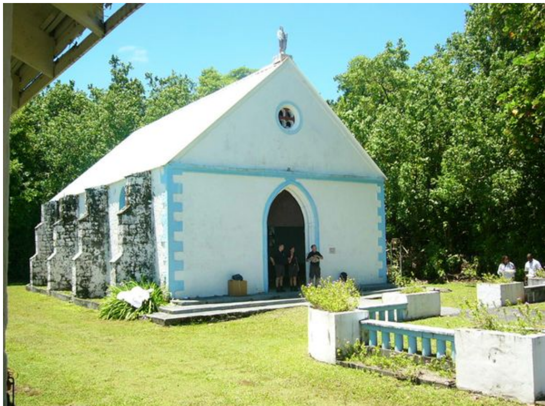
La petite église de Diego Garcia...