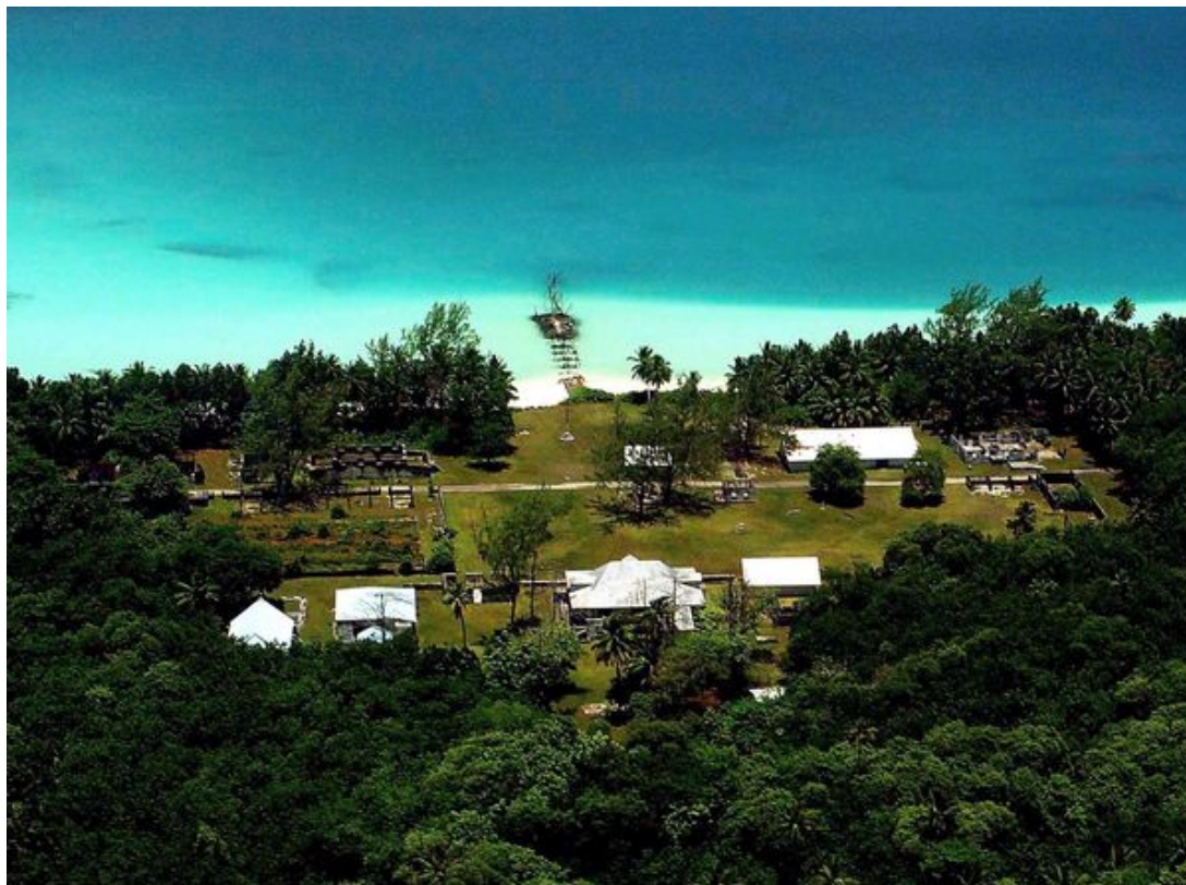
Diego Garcia... le paradis.

7 Lames la Mer : Votre dernier souvenir à Diego Garcia ?