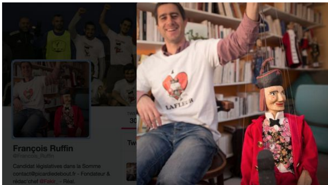
François Ruffin, compte Twitter.

... qui se fait piéger comme un enfant dans « Merci Patron ! »