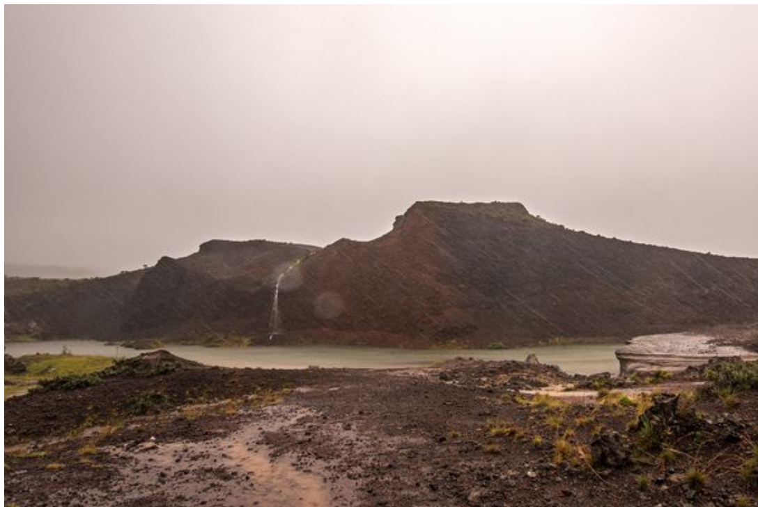
Route du volcan, 7 février 2016.