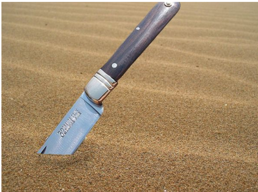
Le "Ti 32", idéal pour jouer à "casse-couteau" dans le sable.

Connaissez-vous la roulade, le ciseau et le zobok ? Ce sont les trois dernières figures d'un jeu oublié qui se pratiquait dans le sable avec un « 32 Dumas », ou « ti-32 » : le jeu « casse-couteau ». Voici les règles de ce jeu-longtemps et l'histoire du « ti-32 ». À vos couteaux !