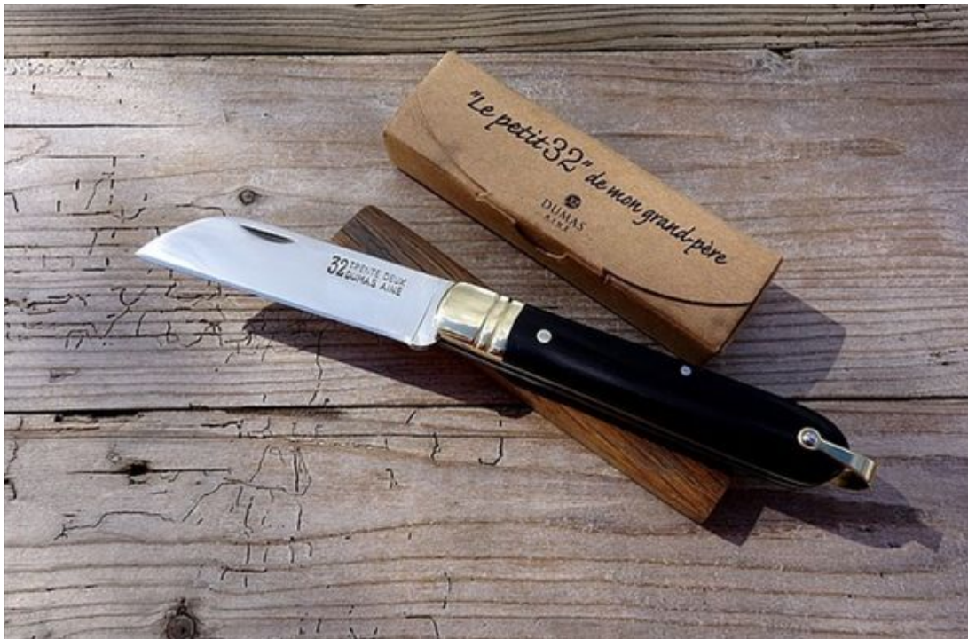
Le célèbre "Ti 32".