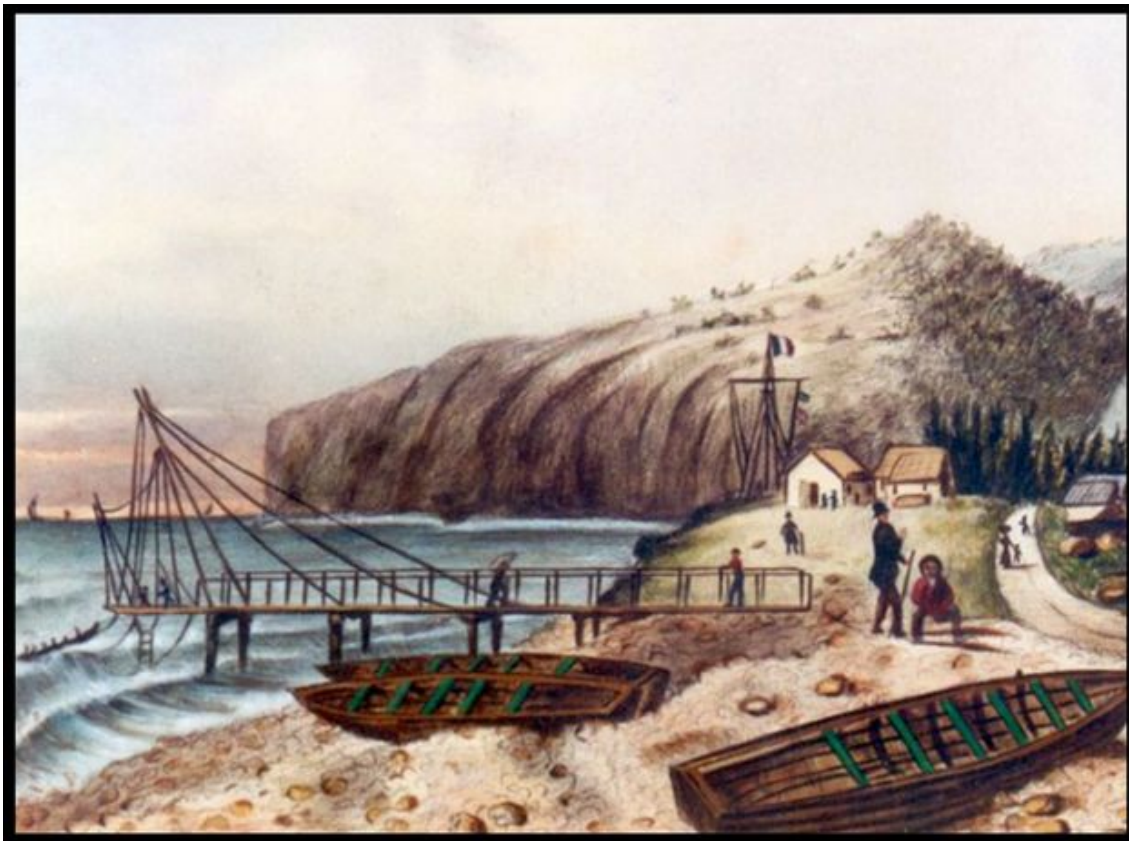
Le bord de mer de La Possession avec le service de batelage, par Antoine Roussin, 1847.