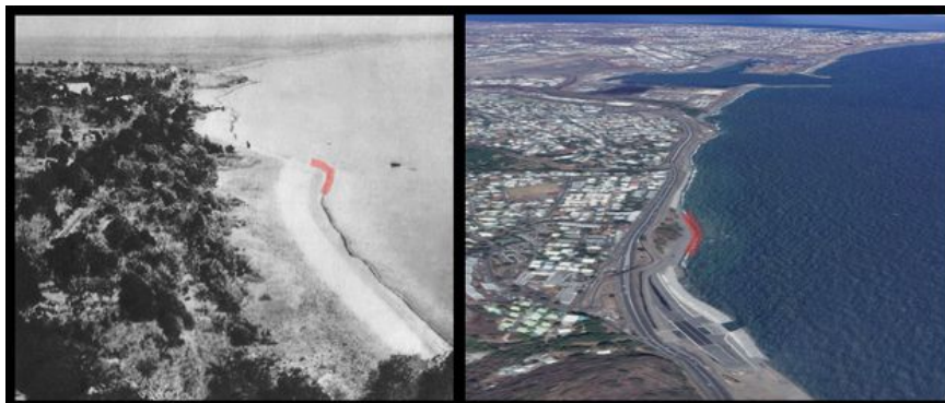
Près de 100 ans séparent ces deux images.