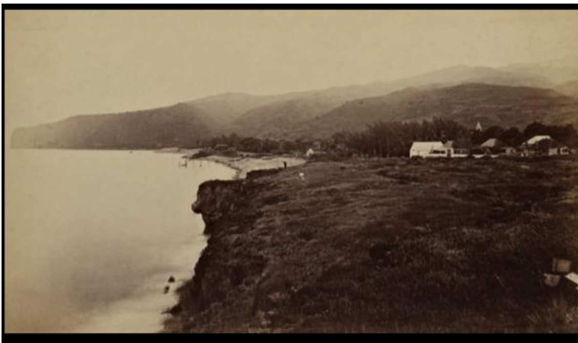
Le bord de mer de La Possession en 1889.