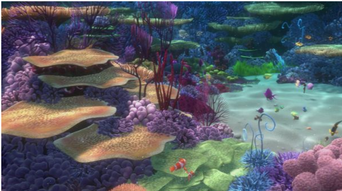
Le monde de Nemo...