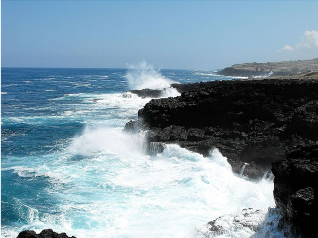
La côte au nord de Saint-Leu.