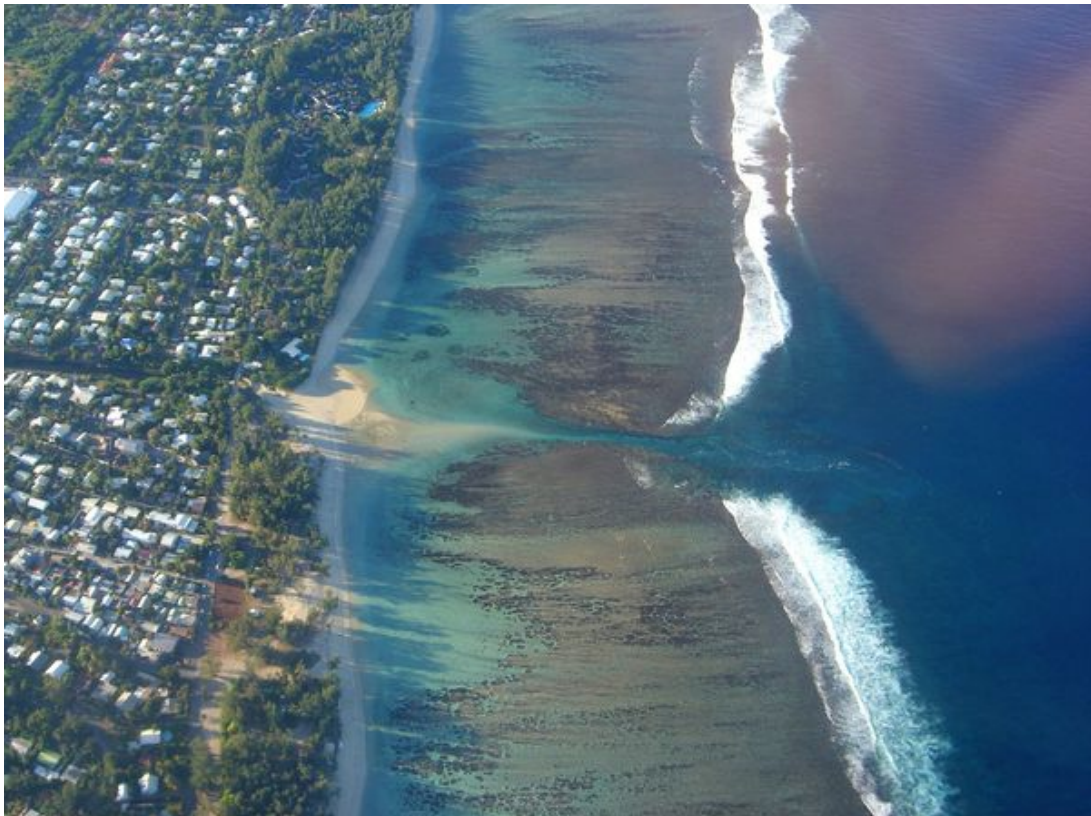
Le lagon de l'Ermitage et sa passe.