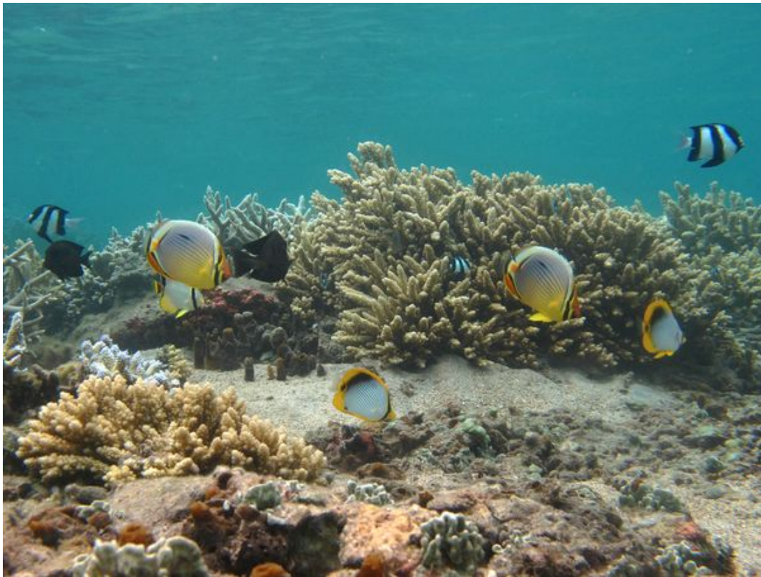
Paysage sous-marin typique du lagon de l'Ermitage.