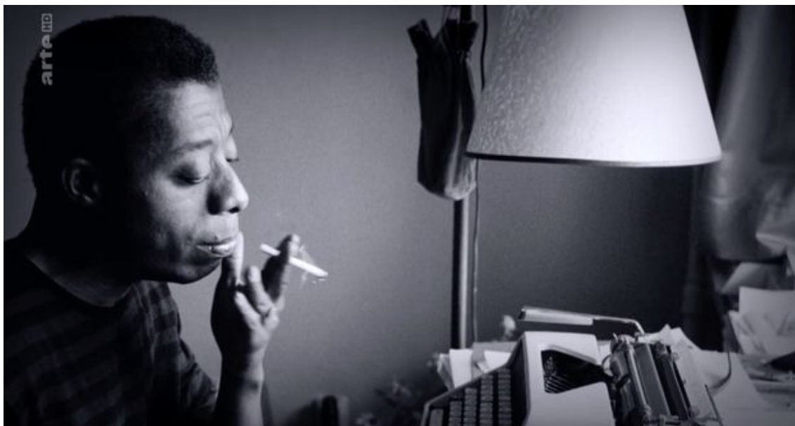
James Arthur Baldwin.

« Je ne suis pas votre nègre » explore la lutte de James Baldwin, à travers ses conférences, ses interventions à la télévision ou sa participation aux manifestations. Il nous fait partager ses réflexions, ses prises de conscience et ses relations amicales et idéologiques avec les leaders noirs engagés pour la reconnaissance des droits civiques. Ces grands noms marquants de la cause noire, Medgar Evers abattu en 1963 dans son garage, Malcom X abattu en 1965 lors d'un meeting, Martin Luther King abattu en 1968 sur le balcon du « Lorraine Motel » à Memphis. Assassinés comme l'ont été et le sont encore nombre d'anonymes du seul fait de la couleur de leur peau.