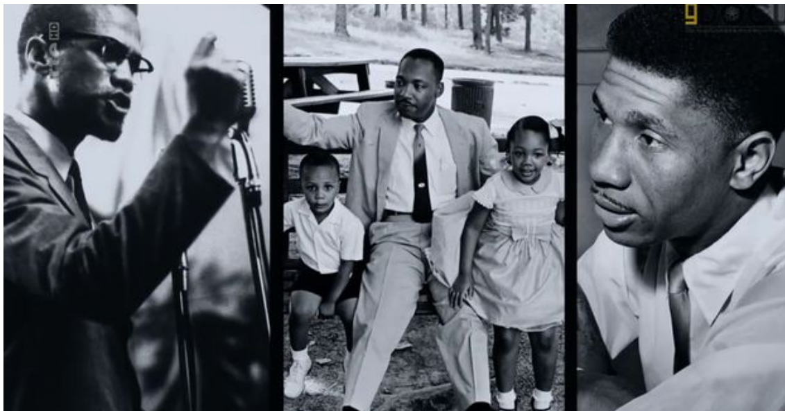
Malcom X, Martin Luther King et Medgar Evers.

« Je ne suis pas votre nègre » explore la lutte de James Baldwin, à travers ses conférences, ses interventions à la télévision ou sa participation aux manifestations. Il nous fait partager ses réflexions, ses prises de conscience et ses relations amicales et idéologiques avec les leaders noirs engagés pour la reconnaissance des droits civiques. Ces grands noms marquants de la cause noire, Medgar Evers abattu en 1963 dans son garage, Malcom X abattu en 1965 lors d'un meeting, Martin Luther King abattu en 1968 sur le balcon du « Lorraine Motel » à Memphis. Assassinés comme l'ont été et le sont encore nombre d'anonymes du seul fait de la couleur de leur peau.