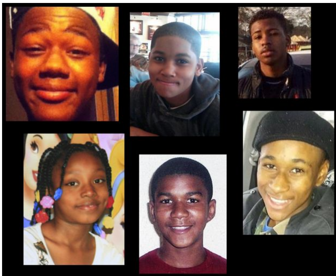
Enfants et adolescents victimes de violences policières aux USA.