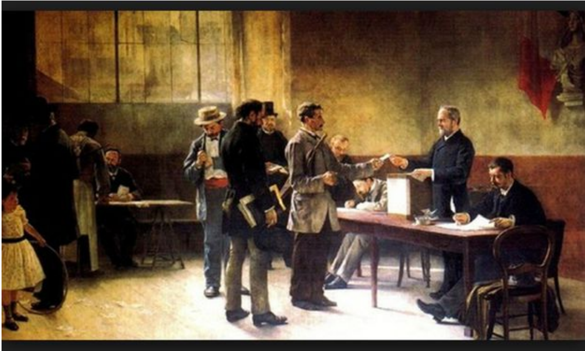
"Le Suffrage universel", par Alfred Bramtot, 1891.