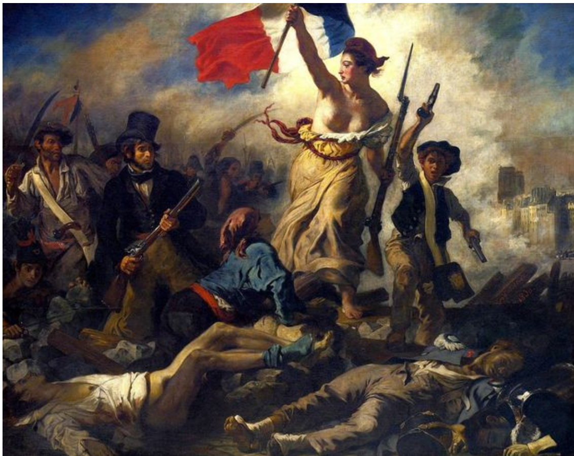
"La liberté guidant le peuple", par Eugène Delacroix, 1830.