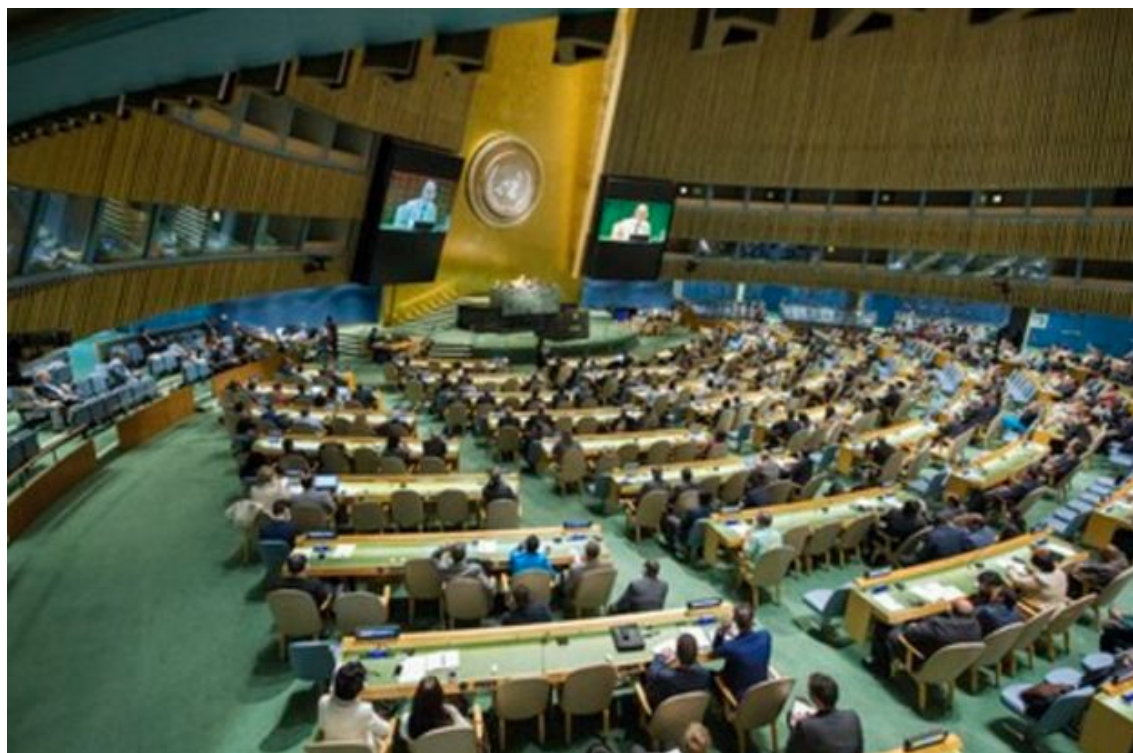
Assemblée générale de l'ONU, séance du 22 juin 2017.