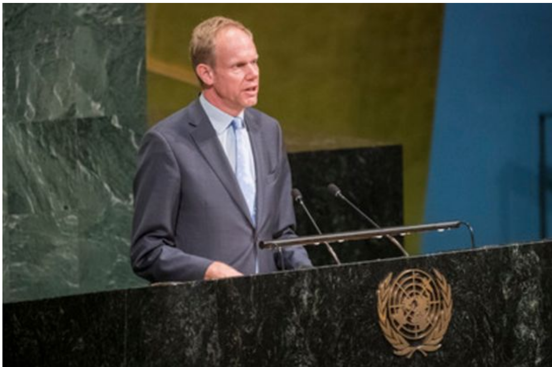
Matthew Rycroft, représentant permanent du Royaume-Uni auprès de l'ONU, s'adressant à l'Assemblée, le 22 juin 2017.