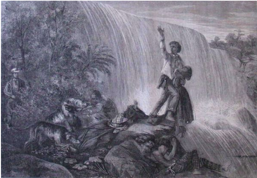
Chasse aux marrons.