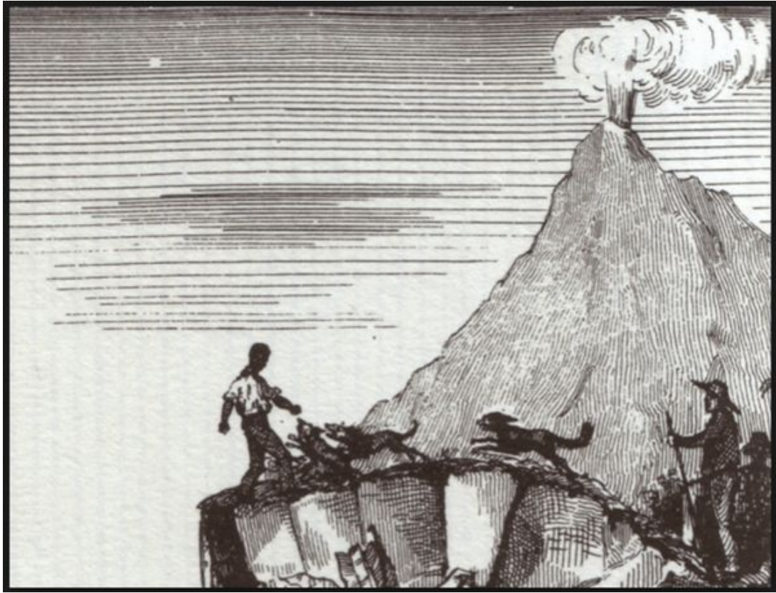
La chasse aux marrons. Lithographie extraite du roman de Louis Timagène Houat : "Les marrons".